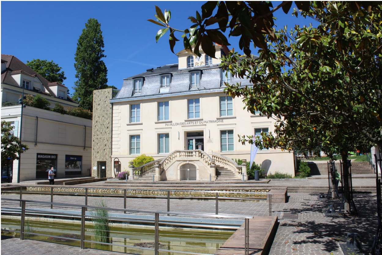
Figure 3: L. Bourriez Fromentin, Ancienne mairie de Châtenay-Malabry devenue le Pavillon des Arts, juin 2021