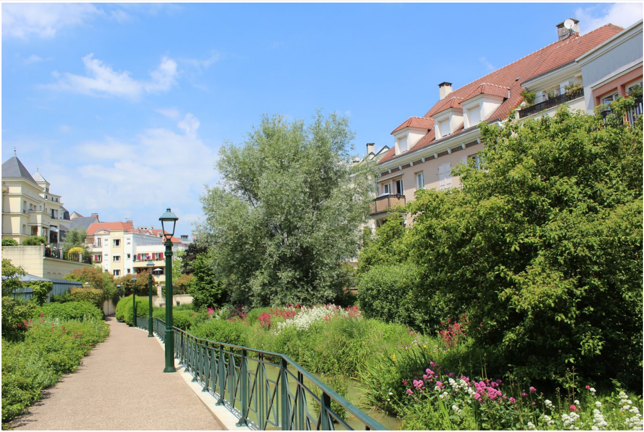
Figure 5: L. Bouriez Fromentin, La « Nouvelle cité-jardins » du Plessis-Robinson, juin 2021