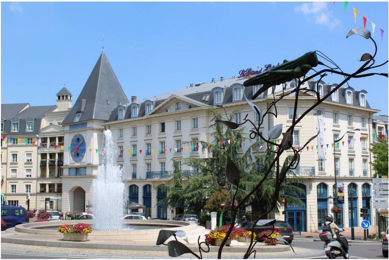
Figure 7: L. Bouriez Fromentin, La Place Charles Pasqua du Plessis-Robinson , juin 2021