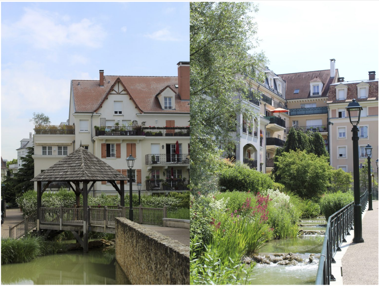
Figure 6: L. Fromentin Bouriez par L. Bouriez Fromentin, La « Nouvelle cité-jardins » du Plessis-Robinson, juin 2021