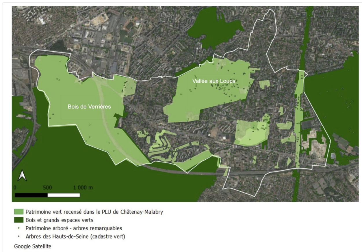
Figure 1: L. Bouriez Fromentin, Les espaces verts présents sur le territoire de Châtenay-Malabry , 2021