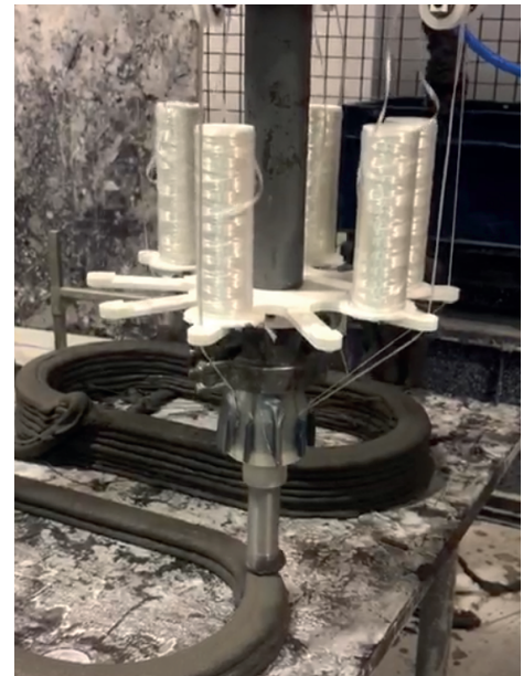
Figure 1. Impression de mortier fibré en continu © ENPC/Navier, 2020.

Les fibres sont entraînées directement au niveau de la tête d'extrusion par le flot de mortier, sans qu'aucune autre motorisation ne soit nécessaire. La gestion et le pilotage de la dépose du boudin renforcé s'en trouvent donc facilités (cf. figure 1). Il est indispensable de maîtriser des paramètres, comme les frottements, le seuil de cisaillement et la viscosité du mortier, car ils permettent la bonne imprégnation et l'entraînement des fibres. C'est dans cette optique qu'ont été développées la modélisation des phénomènes et la métrologie in situ (Ducoulombier, Mesnil, Carneau et al. , 2021).