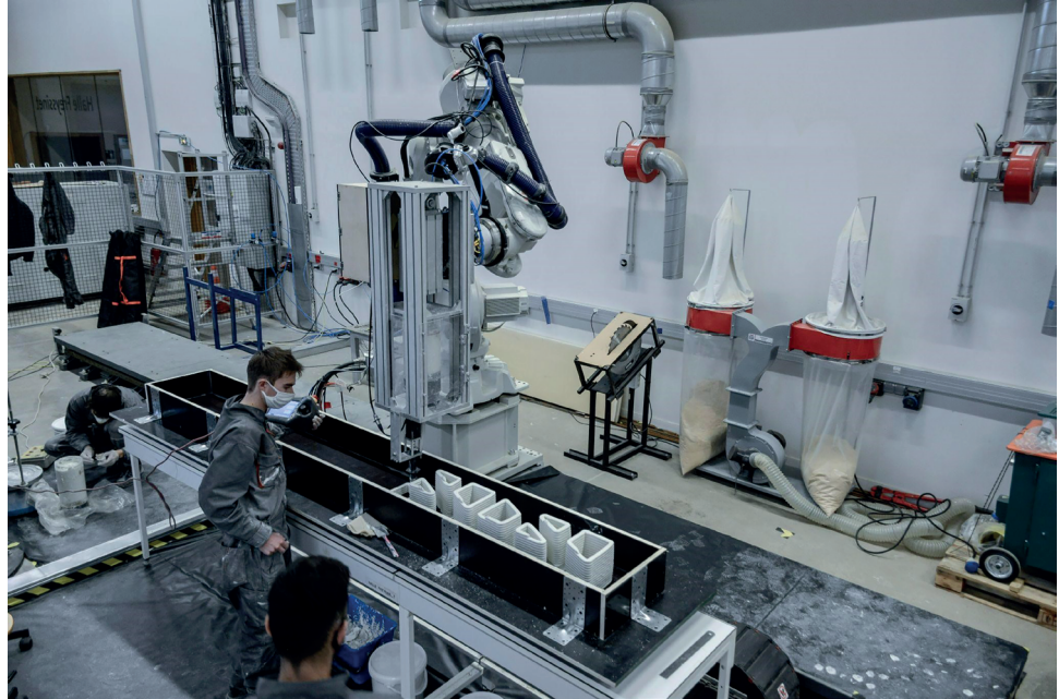
Figure 4. Impression de coffrages recy(clay)ble en argile © ENPC/Navier, 2020.

pour la version monolithique, les poutres restent conformes aux Eurocodes.