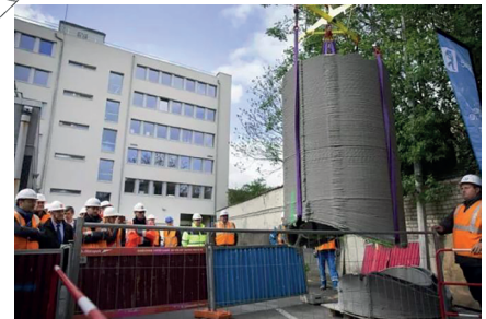
Figure 2a. Design d'un regard de 1,5 m x 1,5 m x 2,3 m d'après relevé sur conduite existante pour impression 3D © XtreeE, 2018.