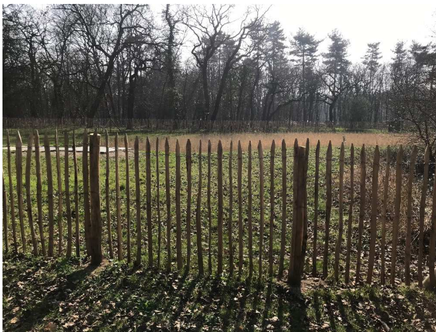
Figure 3. Ganivelle ceignant le filtre planté (photo prise en mars 2021 - Gobert)

En outre la présentation du principe du projet suscite plutôt un sentiment positif (à 85%). Les personnes interrogées ont du mal à définir de prime abord (sans voir directement l'ouvrage) si cet ouvrage modifie le paysage. 33% des visiteurs considèrent que le filtre peut embellir le paysage, 20% qu'il diversifie les espèces végétales présentes et 22% trouvent qu'il ne modifie rien dans l'aspect paysager.