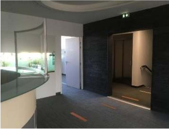
Figure 23 : Mise en image d'un accueil standard