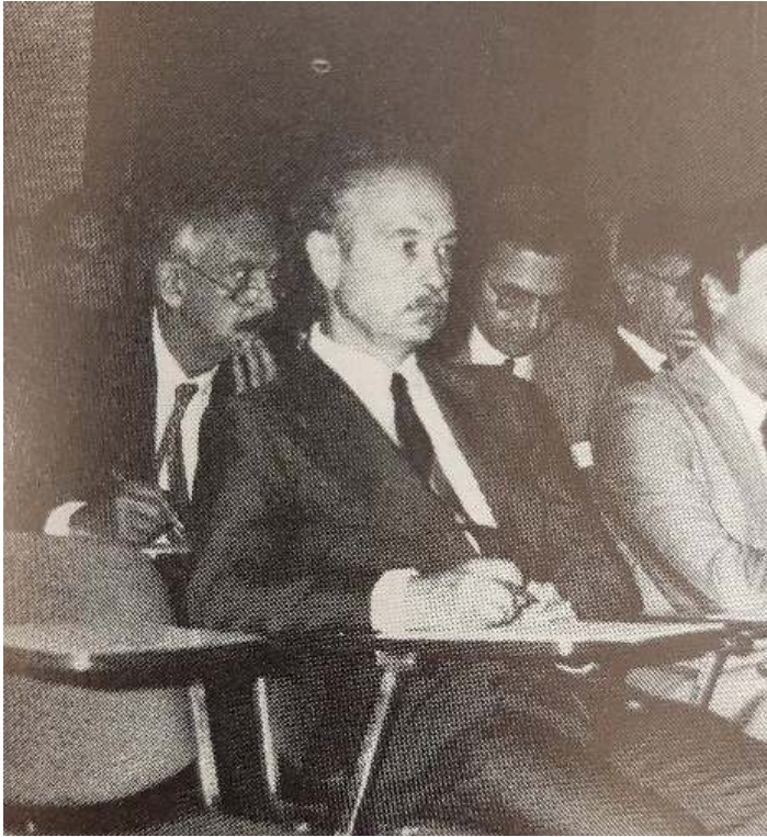
Figure 6 : Une réunion de présidents de chambres et de conseils régionaux de notaires au CSN en 1982