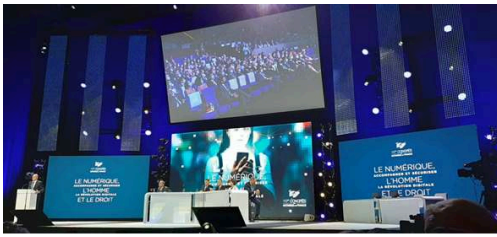
Figure 7 : 117 e Congrès des notaires de France, Séance solennelle d'ouverture, Nice, 23 septembre 2021