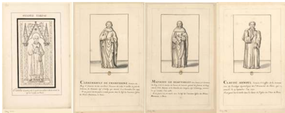
Figure 1 : Tombes de notaires et protonotaires, Archive numérique de la collection Gaignières (1642-1715).