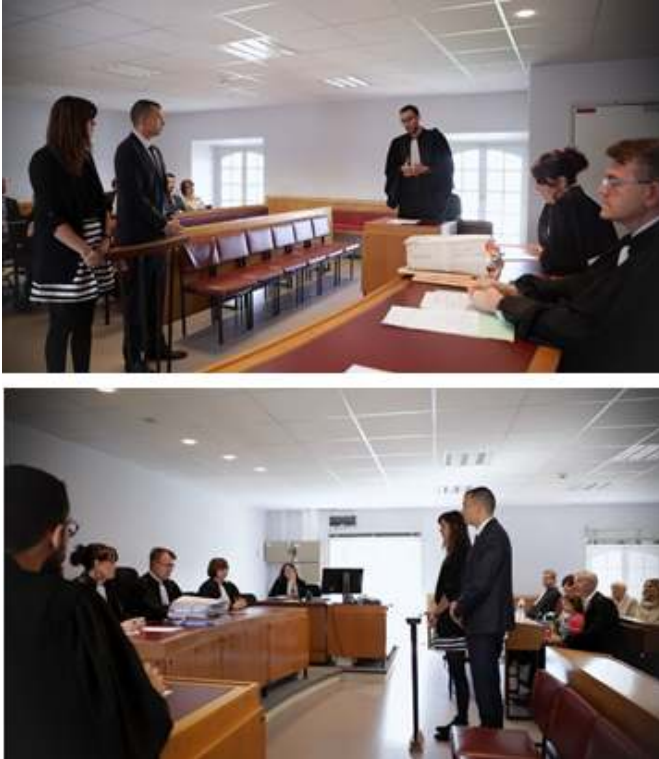
Figure 5 : La prestation de serment du notaire devant un TGI