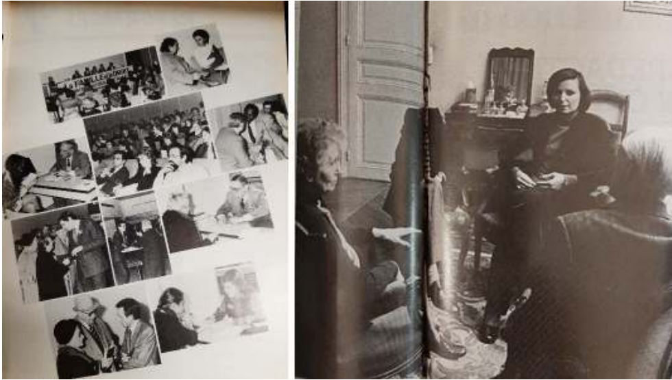
Figure 18 : Reportages (Journées de Maillot et donation-partage), Vie professionnelle (VIP) Notaires , 1981, 1983.