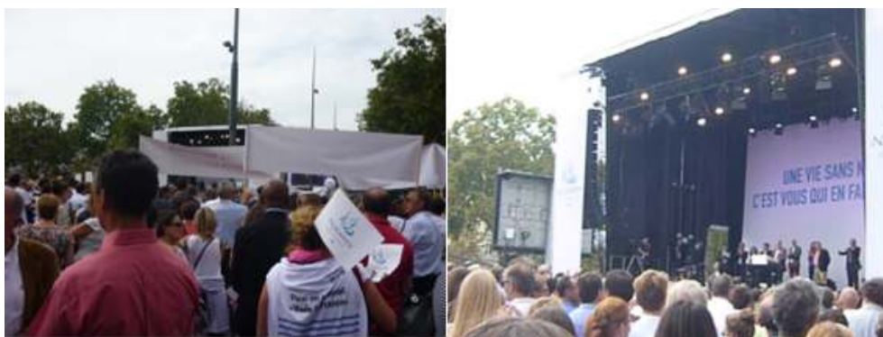
Figure 16 : Manifestation des notaires contre la réforme Macron, Paris, Place de la République, 17 septembre 2014