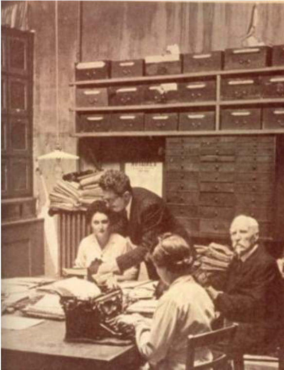
Figure 9 : L'apparition de la machine à écrire

Source : http://droiticpa.eklablog.com/11-l-etude-de-notaire-en-photographies-anciennes-a154258600