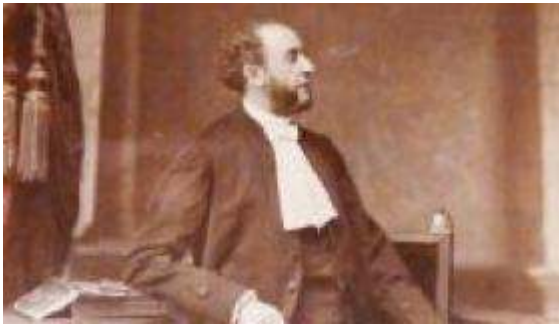
Figure 4 : Le costume du Tiers Etat, adopté par les notaires de Paris