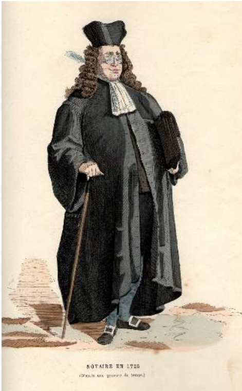
Figure 2 : Notaire en 1725

Source : http://droiticpa.eclablog.com/14-le-notaire-en-costume-archaique-a154259320