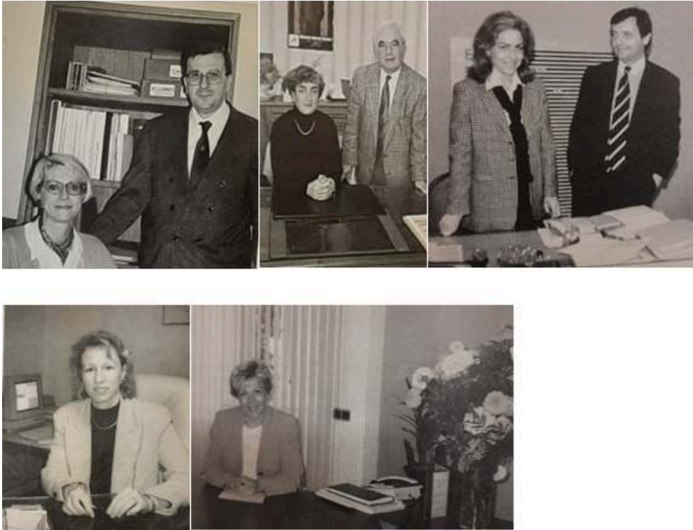
Figure 12 : Des femmes notaires en leur office, Vie professionnelle (VIP), Notaires , 1993-1996.