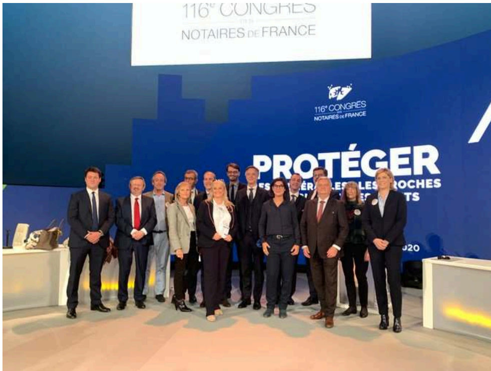
Figure 13 : Équipe du 116 e Congrès des notaires de France, Paris, 2020