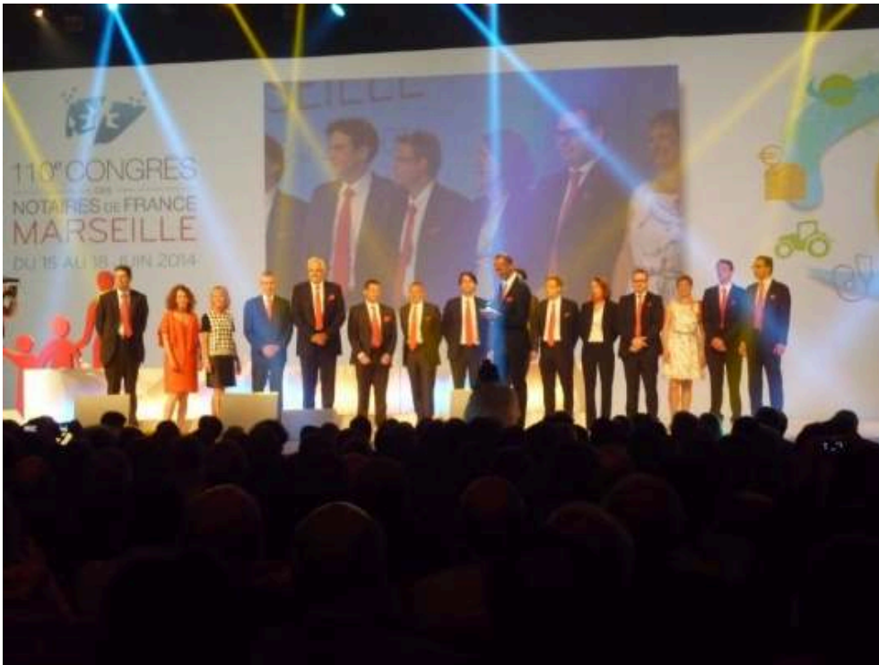
Figure 11 : Équipe du 110 e Congrès des notaires, Marseille, 2014