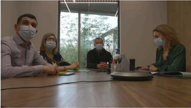
Figure 17 : Vidéo « Une journée avec # 20 : une notaire » (Ludovic B.), 2021