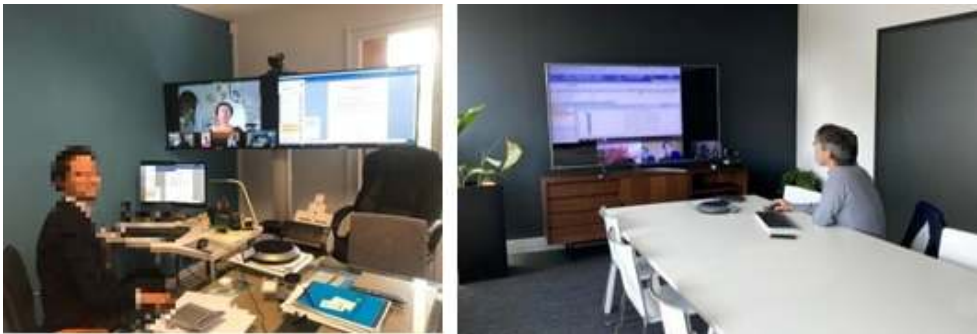
Figure 21 : Post en contexte pandémique