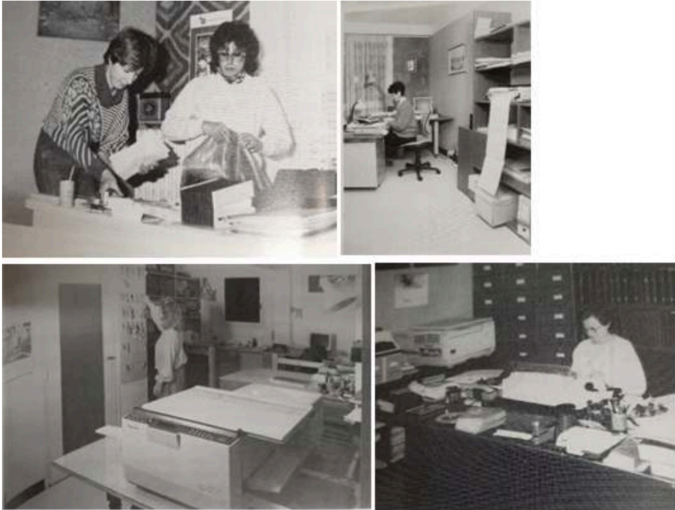
Photo 1, Source : VIP Notaires 1985/4, Images 2 et 3, source : VIP Notaires 1990/2, 4 e photo, source : VIP Notaires 1989/6, n° 131