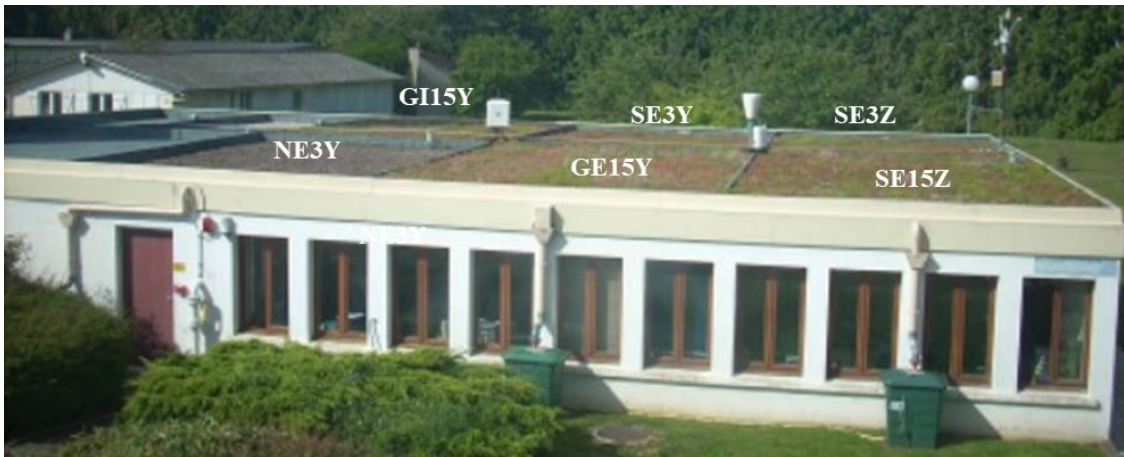
Figure 1: Toiture végétalisée de Trappes. À droite du toit se trouve la station météo, à gauche de cette station, le pluviomètre. Les bacs verts au pied du bâtiment contiennent les augets pour la mesure des débits de drainage issus des gouttières. Les symboles sont définis selon : G : Graminées, S : Sedum, E : Extensive, I : Intensive, 15 cm ou 3 cm pour l'épaisseur de substrat, polystyrène expansé (Y) ou pouzzolane (Z) pour la nature de la couche de drainage et N pour sol nu.

Un pluviomètre et des augets permettent de mesurer respectivement la pluie et le débit de drainage à la sortie de la gouttière de chaque compartiment. Une station météorologique permet de mesurer la température et l'humidité relative de l'air à 2 m au-dessus de la végétation, la vitesse et la direction du vent à 3 m au-dessus de la végétation et le rayonnement net à 1 m au-dessus de la végétation. Pour chaque compartiment, des capteurs ont permis le suivi de la teneur en eau et de la température à différentes profondeurs dans le substrat. On dispose aussi de mesures directes d'évapotranspiration ponctuelles, spatialement et temporellement, à l'aide d'une chambre (Loustau et al. 1991). L'ensemble des données a été acquis à un pas de temps fin sur une période de plusieurs années de juillet 2011 à juillet 2018.