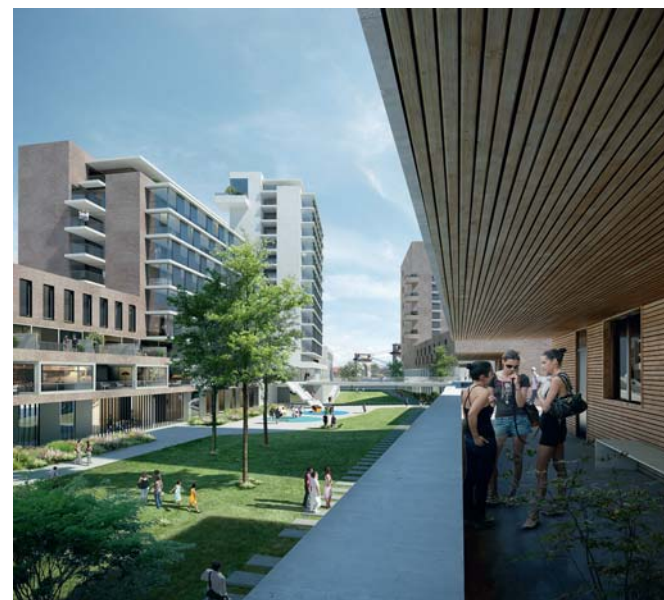
Image 1. ZAC Gare Ardoines, Vitry-sur-Seine : la perspective du jardin © germe & JAM