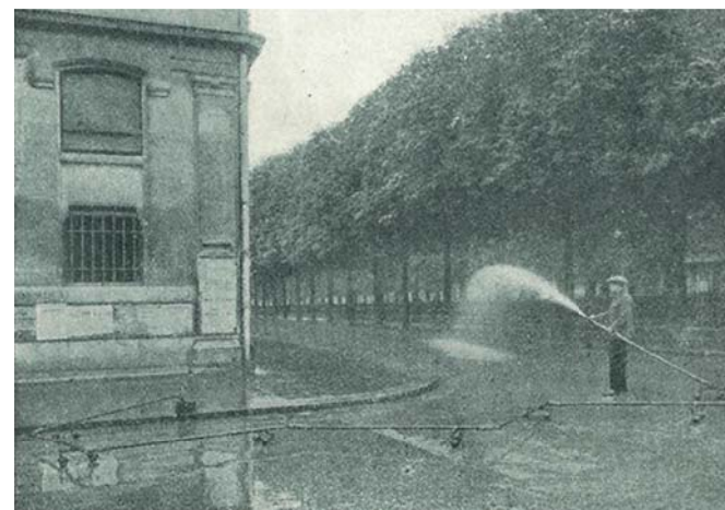
Figure 1. Arrosage de l'espace public à Paris à l'eau non potable (Girard, 1923)

Au XIX e siècle, le fort courant hygiéniste a conduit au développement d'un double réseau d'adduction d'eau : potable et non potable. Depuis lors, le nettoyage de l'espace public s'effectue à l'eau non potable, en plus de son utilisation dans les égouts et pour l'arrosage de certains parcs. Jusqu'à la moitié du XX e siècle, les rues de Paris étaient arrosées pour limiter la formation de nuages de poussière, très inconfortables pour les piétons (cf. Figure 1). Des cartes utilisées par les services techniques prévoyaient ainsi jusqu'à cinq arrosages par jour pour les zones les plus fréquentées sous certaines conditions météorologiques (Girard 1923). L'arrivée des moyens mécaniques de nettoyage mettra progressivement fin à cette pratique, mais les ingénieurs du début du XX e siècle mettaient en garde leurs pairs du fort attachement des riverains à cette pratique, persuadés de ses effets rafraîchissants par fortes chaleurs : « Certains Parisiens ont la sensation [que ces arrosages] procurent de la fraîcheur ; ils les réclameront et longtemps encore trouveront un écho favorable dans la masse de la population » (Girard 1923).