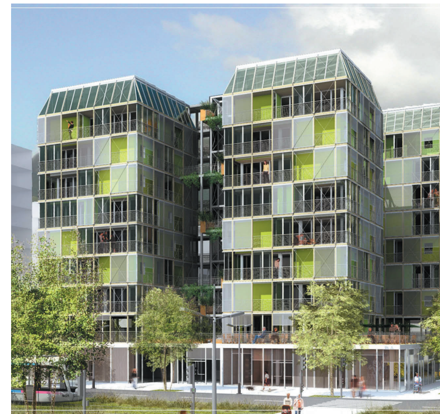
Canopea, projet prototype inspiré de l'étage supérieur des forêts, utilisant le soleil comme unique source d'énergie. Vainqueur 2012 du concours universitaire solar decathlon, invitant les étudiants de 20 universités du monde entier à travailler sur la thématique de l'habitat à énergie positive.

C'est sans doute sur ce point que les recherches dans le domaine énergétique du bâtiment sont les plus stimulantes, parce qu'elles sont dans l'obligation de développer une interdisciplinarité radicale, associant les sciences sociales, économiques et l'ingénierie notamment. Ainsi, les travaux en cours tentent de croiser des approches inductives, déterministes et statistiques, avec des approches mathématiques, déductives et stochastiques, voire toutes ces approches entre elles. Ils débordent le cadre strict de la consommation des bâtiments pour s'élargir aux îlots de chaleur urbains induits par les déperditions énergétiques du bâti, les matériaux, les formes urbaines et les usages. Dorénavant, et c'est sans doute là l'avancée la plus significative de ce champ de recherche, l'usage n'est plus considéré comme une variable d'ajustement, pas plus qu'il n'est réduit à un assemblage d'indicateurs discrétisés : les modèles de représentation de la demande énergétique du bâtiment tentent de l'intégrer dans sa complexité dynamique, au même titre que le cycle de vie du bâtiment et son environnement construit et naturel. ■