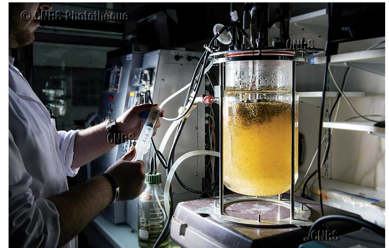
Dispositif de production d'hydrogène par fermentation. Des substrats celluloseux sont dégradés pour produire du biogaz (composé d'hydrogène et de dioxyde de carbone) et des acides gras volatiles.

En 2018, plus de 250 unités du CNRS ont déclaré travailler dans le domaine de l'énergie, où le caractère interdisciplinaire est plus fortement marqué qu'ailleurs. On y retrouve en effet des communautés issues des sciences physiques, chimiques, biologiques, optiques, électroniques, de l'ingénierie, mais aussi humaines et sociales. Les objectifs sont d'explorer de nouveaux leviers pour répondre à terme à la perspective de la neutralité carbone. Les activités ambitionnent d'atteindre des ruptures, qu'elles soient technologiques (stockage et séquestration du carbone, forte pénétration des énergies renouvelables et d'équipements à hydrogène, mutation numérique des transports et des équipements énergétiques...) ou socio-économiques (effets de l'évolution des modes de vie sur la consommation et les déplacements).