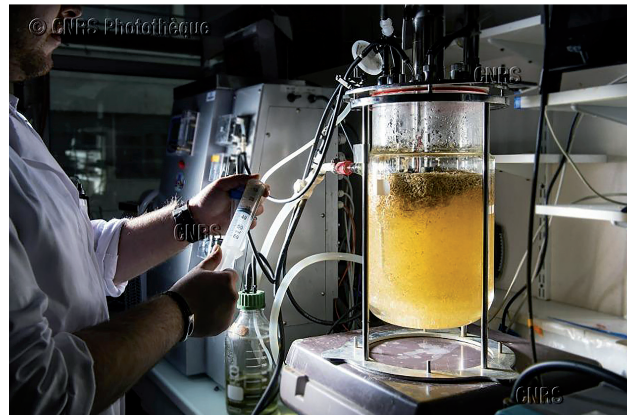
Dispositif de production d'hydrogène par fermentation. Des substrats celluloseux sont dégradés pour produire du biogaz (composé d'hydrogène et de dioxyde de carbone) et des acides gras volatiles.

En 2018, plus de 250 unités du CNRS ont déclaré travailler dans le domaine de l'énergie, où le caractère interdisciplinaire est plus fortement marqué qu'ailleurs. On y retrouve en effet des communautés issues des sciences physiques, chimiques, biologiques, optiques, électroniques, de l'ingénierie, mais aussi humaines et sociales. Les objectifs sont d'explorer de nouveaux leviers pour répondre à terme à la perspective de la neutralité carbone. Les activités ambitionnent d'atteindre des ruptures, qu'elles soient technologiques (stockage et séquestration du carbone, forte pénétration des énergies renouvelables et d'équipements à hydrogène, mutation numérique des transports et des équipements énergétiques...) ou socio-économiques (effets de l'évolution des modes de vie sur la consommation et les déplacements).