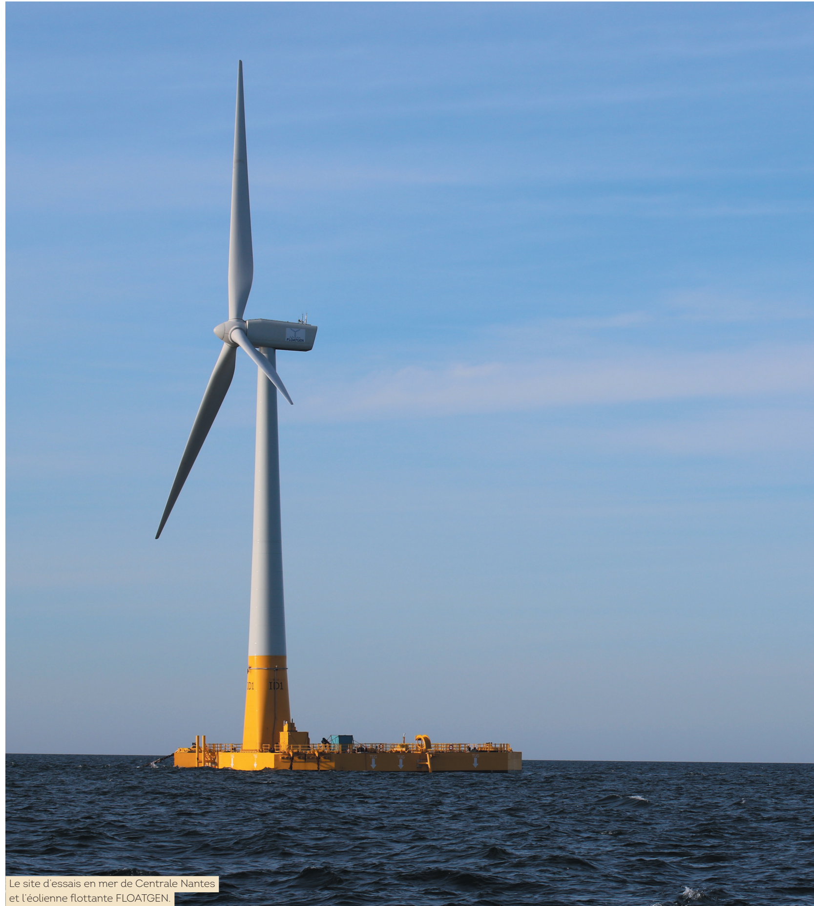
Le site d'essais en mer de Centrale Nantes et l'éolienne flottante FLOATGEN.