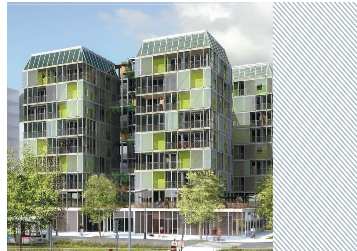
Canopea, projet prototype inspiré de l'étage supérieur des forêts, utilisant le soleil comme unique source d'énergie. Vainqueur 2012 du concours universitaire solar decathlon, invitant les étudiants de 20 universités du monde entier à travailler sur la thématique de l'habitat à énergie positive.

C'est sans doute sur ce point que les recherches dans le domaine énergétique du bâtiment sont les plus stimulantes, parce qu'elles sont dans l'obligation de développer une interdisciplinarité radicale, associant les sciences sociales, économiques et l'ingénierie notamment. Ainsi, les travaux en cours tentent de croiser des approches inductives, déterministes et statistiques, avec des approches mathématiques, déductives et stochastiques, voire toutes ces approches entre elles. Ils débordent le cadre strict de la consommation des bâtiments pour s'élargir aux îlots de chaleur urbains induits par les déperditions énergétiques du bâti, les matériaux, les formes urbaines et les usages. Dorénavant, et c'est sans doute là l'avancée la plus significative de ce champ de recherche, l'usage n'est plus considéré comme une variable d'ajustement, pas plus qu'il n'est réduit à un assemblage d'indicateurs discrétisés : les modèles de représentation de la demande énergétique du bâtiment tentent de l'intégrer dans sa complexité dynamique, au même titre que le cycle de vie du bâtiment et son environnement construit et naturel. ■