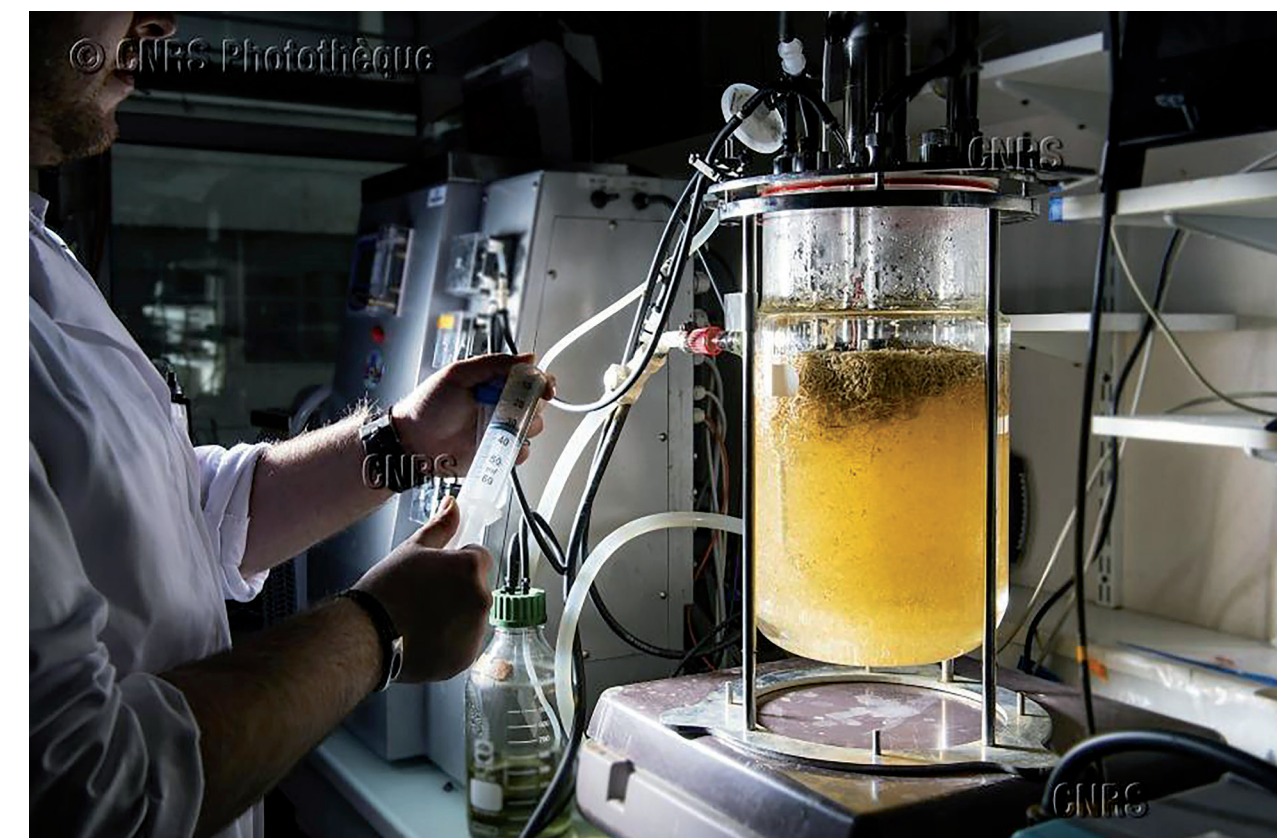
Dispositif de production d'hydrogène par fermentation. Des substrats celluloseux sont dégradés pour produire du biogaz (composé d'hydrogène et de dioxyde de carbone) et des acides gras volatiles.

En 2018, plus de 250 unités du CNRS ont déclaré travailler dans le domaine de l'énergie, où le caractère interdisciplinaire est plus fortement marqué qu'ailleurs. On y retrouve en effet des communautés issues des sciences physiques, chimiques, biologiques, optiques, électroniques, de l'ingénierie, mais aussi humaines et sociales. Les objectifs sont d'explorer de nouveaux leviers pour répondre à terme à la perspective de la neutralité carbone. Les activités ambitionnent d'atteindre des ruptures, qu'elles soient technologiques (stockage et séquestration du carbone, forte pénétration des énergies renouvelables et d'équipements à hydrogène, mutation numérique des transports et des équipements énergétiques...) ou socio-économiques (effets de l'évolution des modes de vie sur la consommation et les déplacements).