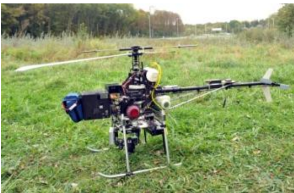
Figure 1 : Drone utilisé pour les essais