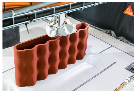
Fig. 3. Processus d'impression Sika

Le processus d'impression Sika offre la possibilité d'imprimer en continu, sans rupture, jusqu'à 4 t/h, avec une vitesse horizontale d'extrusion pouvant atteindre 1 m/s et une vitesse verticale de construction d'environ 10 cm/min.