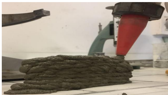
Fig. 1 : test en laboratoire pour vérifier l'imprimabilité d'un mortier (ici, sable recyclé + ciment portland)

Les mortiers ont tout d'abord été formulés au laboratoire à petite échelle. L'imprimabilité (extrudabilité et "buildabilité") des mortiers a été testée au moyen d'un dispositif simple permettant de simuler manuellement l'impression (fig. 1). Ensuite, deux formulations contenant du sable recyclé, avec du ciment portland ou du laitier activé ont été mises en œuvre à plus grande échelle (fig. 2) en l'utilisant l'imprimante 3D développée à l'IMT Lille Douai dans le projet MATRICE. Enfin, la résistance en compression des deux mortiers imprimés a été déterminée à 28 et 90 jours sur éprouvette 4x4x16 normalisées (fig. 3).