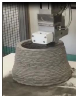
Fig. 2 : impression 3D d'un mortier « tout recyclé »