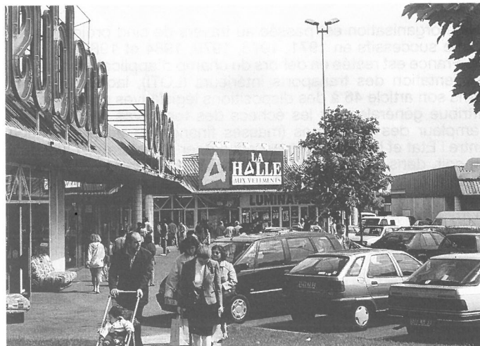
Fig. 1. «Ainsi la zone centrale a perdu 190 000 emplois alors que la grande couronne connaissait 217 000 créations ou transferts d'emplois. Il y a donc transfert durable de substance entre le centre et les périphéries régionales». Zone d'activités et de commerces de Paris-Nord II.

France à raisonner à une échelle supérieure, celle du grand Bassin parisien (incluant les sept Régions limitrophes). Concernant la gestion des transports, certains projets d'infrastructures pren-