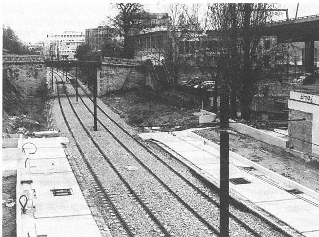
Fig. 4. La réalisation du Tram Val-de-Seine (dont l'ouverture sera retardée de plus d'un an à cause des exigences abusives du maire de Puteaux) est financée à hauteur de 13,7 % par le conseil général des Hauts-de-Seine. État actuel des travaux au pont de St-Cloud.