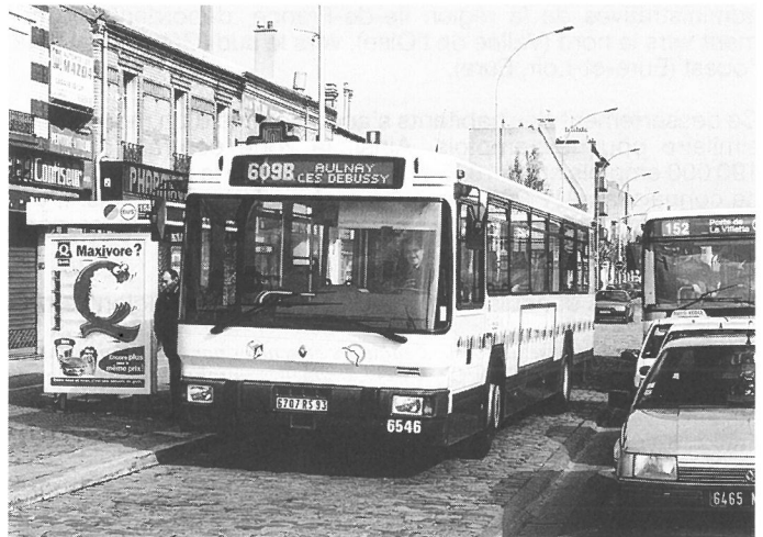
Fig. 2. «Les transports collectifs peuvent servir d'outils de cohésion et de structuration de l'espace départemental. Ils peuvent également constituer un support d'image idéal pour les collectivités désireuses de dépasser le stéréotype de la banlieue». À la Courneuve, autobus de la société TRA, financée en partie par le conseil général de Seine-St-Denis.

• Les communes de l'Île-de-France sont moins riches que les conseils généraux, mais elles n'en tiennent pas moins à exploiter au mieux les compétences qui leur ont été attribuées par les lois de décentralisation. Elles n'ignorent pas de surcroît que le transport collectif est l'affaire des communes ou des groupements de communes en province. Elles sont par ailleurs soumises à des pressions croissantes de la part de leurs administrés qui comptent sur elles pour résoudre leurs problèmes de déplacement, et qui ignorent en règle générale la compétence générale du STP sur les transports collectifs franciliens, incluant la petite ligne suburbaine plus ou moins intercommunale qui les dessert. Si toutes les communes ne réagissent pas de la même manière, certaines d'entre elles commencent à travailler ensemble, notamment dans le cadre de regroupements intercommunaux d'études motivés par la préparation du nouveau Schéma directeur régional (SDRIF) , qui paraissent pouvoir amorcer des opérations effectives.