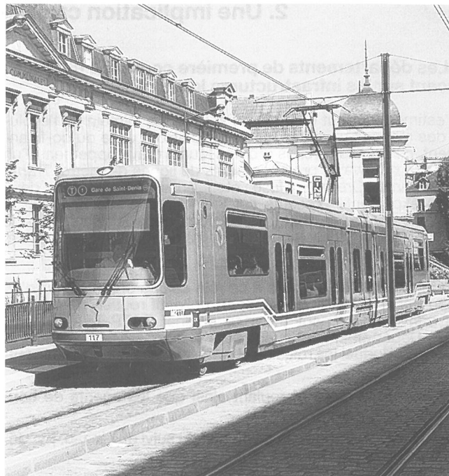
Fig. 5. «Pour ce faire, (ces collectivités jeunes) estiment qu'il est nécessaire que les habitants prennent conscience de leur appartenance à un territoire départemental [...]. Cet objectif ne peut être atteint qu'en organisant une offre de qualité susceptible de détourner la clientèle des lignes radiales». Le conseil général de Seine-St-Denis a été très moteur pour la construction du tramway St-Denis – Bobigny.

gueur jusqu'à l'heure actuelle en Île-de-France des décrets de 1949 régissant l'organisation des transports. Pour ce faire, il faut ménager les transporteurs (parfois très nombreux) en place, dont les droits d'exploitation sont des « éléments de fonds de commerce », pour reprendre les termes d'un récent arrêt du Conseil d'État. Les restrictions qui en découlent pour la mise en place de nouveaux exploitants (interdictions de trafic local par exemple) sont de moins en moins bien supportées par les services départementaux et par les transporteurs les plus dynamiques qui s'estiment pénalisés. Pour contourner les obstacles, les départements sont obligés de faire preuve d'imagination, notamment lorsqu'ils désirent mettre en place une structure unique de gestion d'un réseau structurant : la constitution de la SA Albatrans en Essonne (4), en est le meilleur exemple.