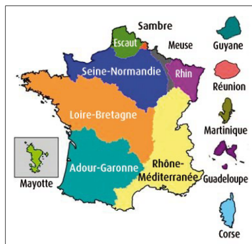
Carte des districts hydrographiques français.

Les MEFM et les MEA sont désignées dans les SDAGE.