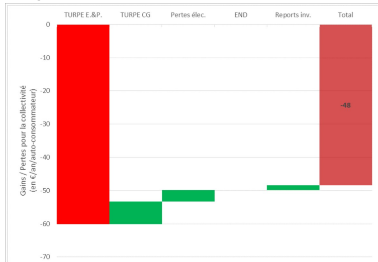
Figure 2 : Bilan global pour la collectivité des impacts de l'autoconsommation sur le périmètre des gestionnaires de réseaux de distribution (cas sans stockage)

On peut tout de même relever que, comme les gains économiques des auto-consommateurs, les pertes des gestionnaires de réseaux dépendent de l'option de tarification considérée.