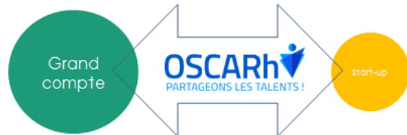
Figure 4 : Immersion grand compte/start-up proposé par la start-up OSCARh

travaux à thématiques transverses ou encore des périodes d'immersions du top management dans des équipes opérationnelles ou bien de salariés de grands groupes dans des start-up, toutes ces méthodes permettent une prise de conscience de la réalité du terrain, des vrais besoins de chacun ainsi que des nouvelles méthodes de travail. Enfin, le suivi de la démarche suggère la mise en place d'indicateurs (KPI) pertinents dans la mise en place d'une feuille de route. Il est indispensable que faire évoluer le choix de ces KPI en fonction de la maturité de la démarche [Zaheer, 1998].