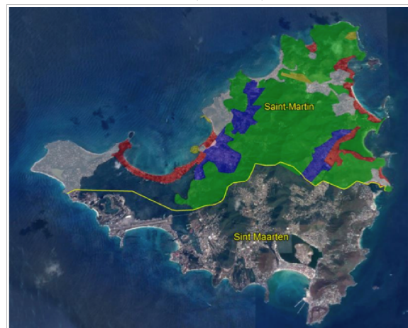
Proposition de stratégie d'aménagement de Saint-Martin - T.FAGIANI

Il doit prendre en compte les zones à risques (en rouge) et la préservation des espaces naturels (en vert) opportunités de développement pour Saint-Martin. Il devra prévoir une densification des zones urbanisées (en bleu).