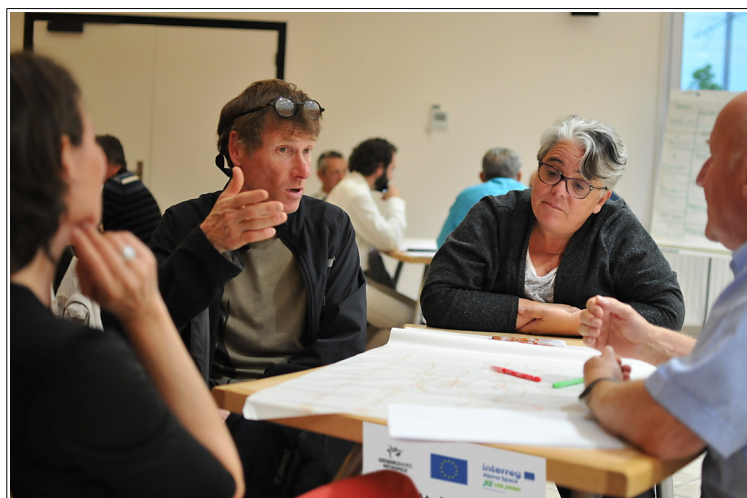
31 acteurs techniques, administratifs et associatifs ont imaginés ensemble les personnages du jeu

cartographie sensible. Ce format participatif était l'occasion pour Grenoble-Alpes Métropole de tester une animation innovante avec des acteurs qui pourraient un jour se retrouver lors d'un comité de site du Bois des Vouillants.