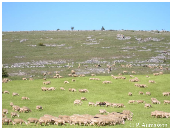
Les prairies temporaires (au premier plan) sont de plus en plus utilisées au détriment des parcours (en arrière plan)

L'obligation de résultats a engendré un développement des travaux d'entretien des surfaces. Cette inflexion est remarquable dans un territoire où la déprise agricole a été continue depuis 1850. Cependant le recours au feu (brûlage dirigé) ou aux moyens mécaniques (gyrobroyage) parfois très intenses (épierrage, dérochage) est majoritaire par rapport à la reconquête par le pastoralisme. Ce dernier n'est en effet pas assez encouragé dans les politiques publiques.