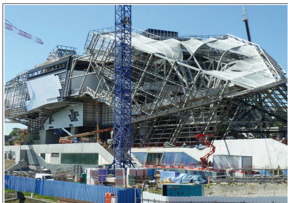
Légende : le musée des Confluences, réalisé en mandat par la Serl pour le Département

La Serl doit donc diversifier son activité pour assurer la pérennité de la structure.