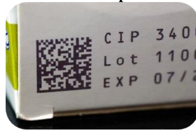
Figure 1 : DataMatrix sur une boîte de médicament

Le règlement prévoit, sous certaines conditions, un assouplissement dans le cas de la délivrance au sein d'un établissement de santé (art 25.2) : l'IU peut être désactivé tant que le médicament est en possession matérielle de l'établissement, et non uniquement au moment de la dispensation, à condition qu'il n'y ait pas de vente entre livraison et délivrance du produit.