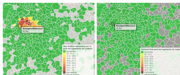
Fig 5 : Accessibilité d'un ménage intermédiaire (couple avec un enfant) avec et sans plafond Pinel.

En complément des analyses mises en lumière précédemment, un tel outil de cartographie peut servir de support à l'évaluation de l'impact des politiques du logement implémentées. Aussi, nous nous sommes attachés à appliquer ce raisonnement au dispositif Pinel, afin de déterminer son efficacité sur l'accessibilité du secteur intermédiaire.