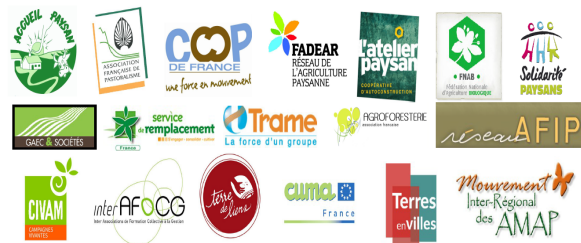
Figure 1 : Logos des 18 ONVAR

les 18 ONVAR retenus en 2014, donne une idée de cette diversité. Les ONVAR sont, dans leur majorité, des structures disposant de compétences axées sur les démarches collectives, dans lesquelles les agriculteurs sont parties prenantes et plus seulement clients. Ils fonctionnent avec des approches ascendantes, portées par les innovations du terrain. Tous ne s'inscrivent toutefois pas dans ce cadre, comme Coop de France par exemple.