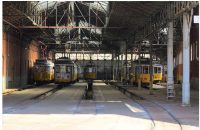
■ Figure 5 : vue d'une des halles du dépôt de Santo Amaro

Début 2017, les travaux de remise en service de la ligne 24E, une des dernières victimes des vagues de démantèlement des années 1990, ont débuté, avec notamment le