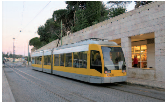
■ Figure 3 : une rame Siemens à plancher bas sur la ligne 15E.

En 2017, le réseau compte 25 km de voies à écartement de 900 mm, électrifiées en 600 V continu. Il est parcouru par cinq lignes, identifiées par leur terminaison en « E » (pour Elétrico ). Une partie des voies n'est plus exploitée qu'à des fins touristiques. Il existe par ailleurs de nombreuses sections de voies non exploitées mais toujours en place.