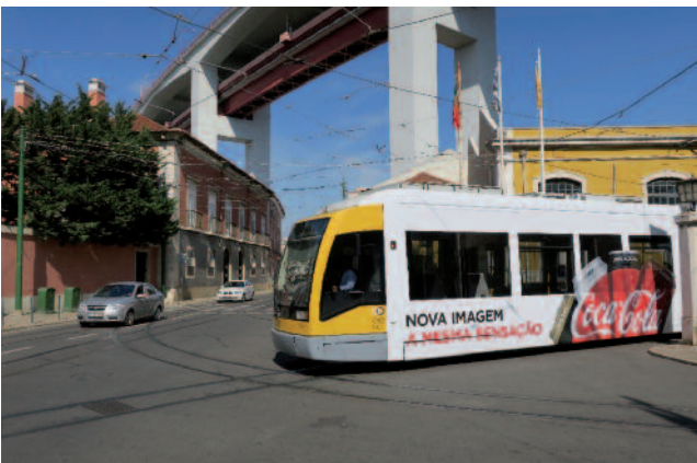
■ Figure 4 : une rame Siemens à plancher bas sortant du dépôt de Santo Amaro, et partant en direction de Belém. Le dépôt est branché sur les voies empruntées par la ligne 15E, qui empruntent l'ancienne route royale allant de Lisbonne à Belém. Le site est dominé par le pont du 25 avril, dont le tablier inférieur porte la voie de chemin de fer franchissant le Tage, et le tablier supérieur; l'autoroute.

Le réseau de tramway est exploité par Carris.