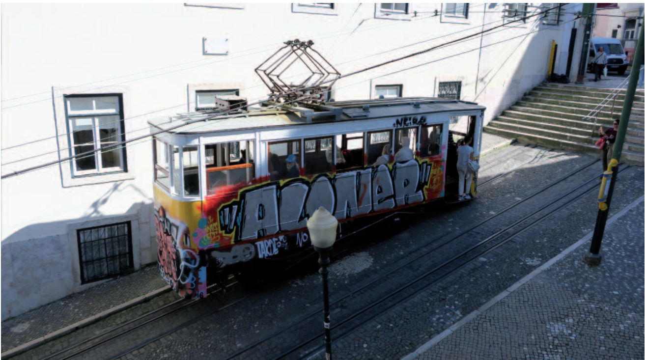
■ Figure 7 : un des véhicules de l'Elevador da Glória.

De plus, plusieurs ascenseurs publics ont été construits à la même époque, dont le célèbre Elevador de Santa Justa.