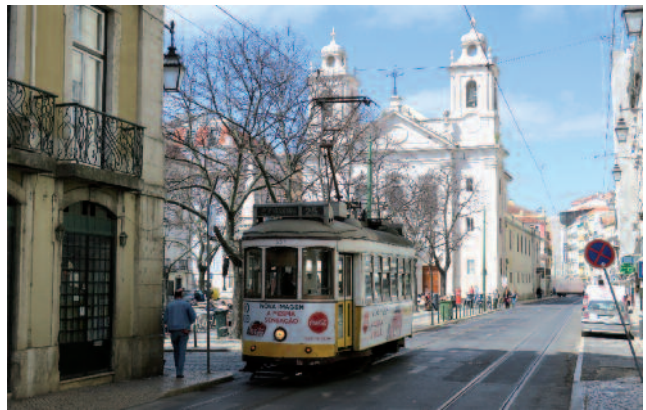
■ Figure 6 : une rame de la flotte des « remodelados » sur la ligne 25E, en direction de la Rua da Alfândega. Photo prise Rua de São Paulo, avec en fond l'église Saint Paul en fond, reconstruite après le tremblement de terre de 1755 (Igreja de São Paulo)

TAVARES DIAS Marina, História do eléctrico da Carris. The History of the Lisbon Trams . Quimera, 2001, 159 p.