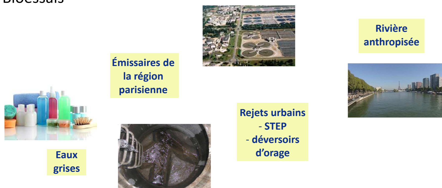
Figure 1 : Points du cycle urbain de l'eau échantillonnés dans le projet