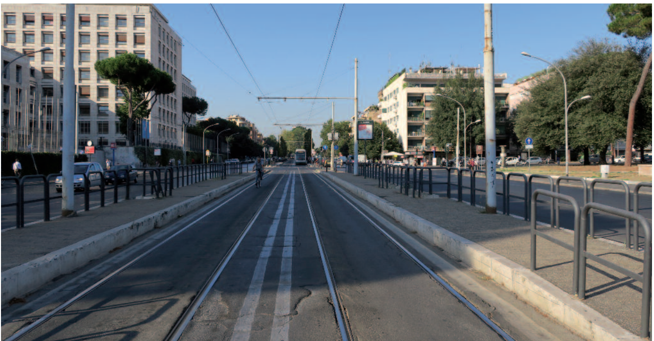
Figure 1 : Site propre de la ligne 3, à la station Circo Massimo (remarquer l'aménagement sommaire), sur le tronçon fermé pour modernisation de 2005 à 2013.

Plusieurs projets d'extension du réseau sont évoqués, mais aucun n'est pour l'instant en travaux : il faut dire que les ressources financières de la municipalité, par ailleurs lourdement endettée, sont très sollicitées par l'interminable chantier du métro C.