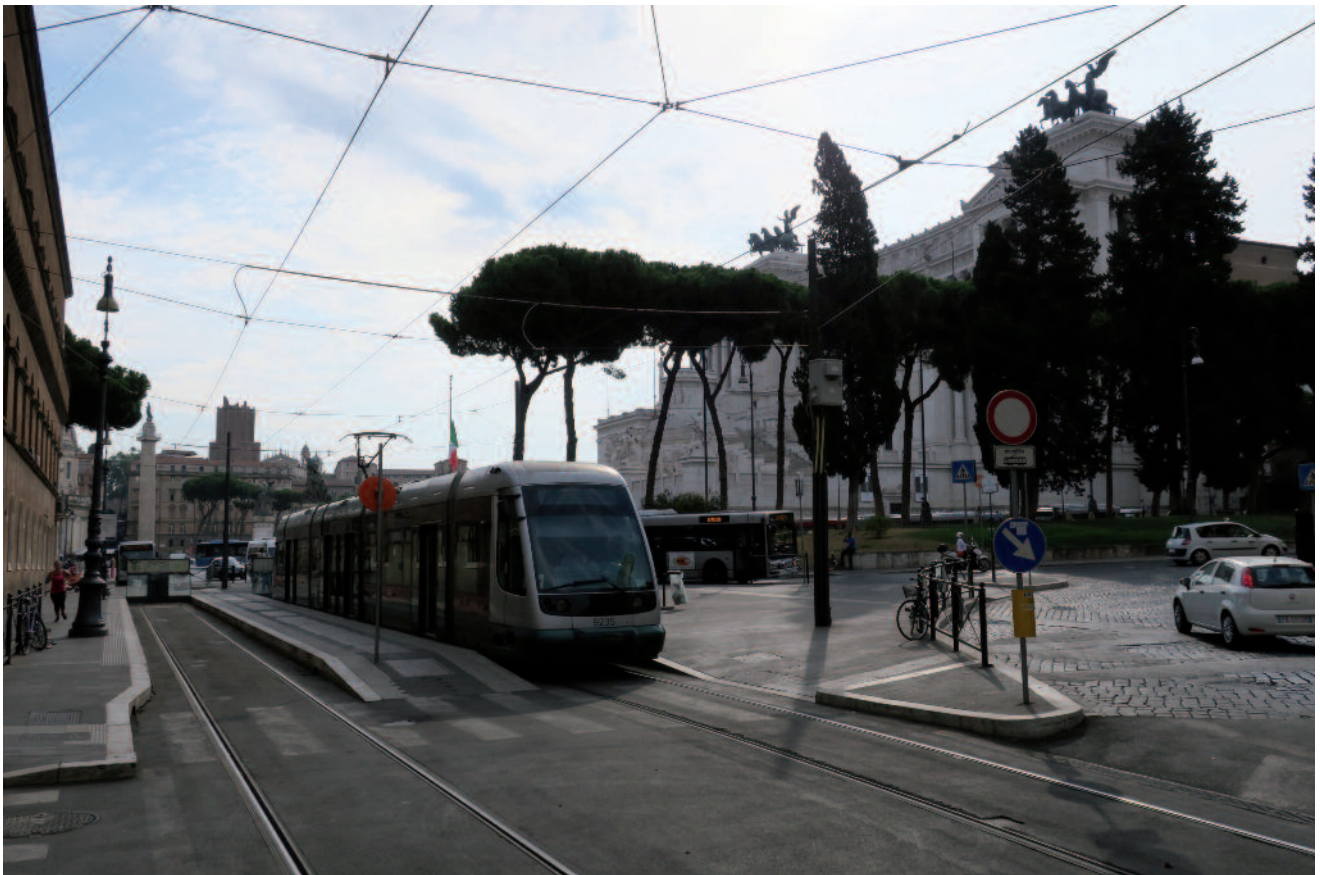
Figure 2: Terminus de la ligne 8 à la Piazza Venezia : deux voies en tiroir, en attendant un prolongement vers Termini ou Colosseo? (photo L. Charansonney).