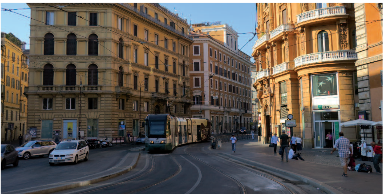
Figure 4 : Une rame de la ligne 8 Via Arenula, en direction de la Piazza Venezia (vers la gauche du cliché). Le site archéologique du Largo di Torre Argentina est derrière le photographe.

Dans son Bilan di Esercizio al 31.12.2015 , l'ATAC fait état des statistiques suivantes :