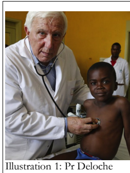
Illustration 1: Pr Deloche

La CDE est une ONG médicale française créée en 1994 par un chirurgien cardiaque : le Pr Alain Deloche. Construite autour de d'un axe santé et d'un axe éducation, son but est double : rendre accessible des soins très spécialisés et coûteux (dans plus de 85% des cas des chirurgies cardiaques) aux enfants les plus pauvres et soutenir l'éducation des enfants.