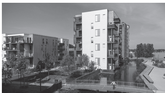
L'éco-quartier de Ginkgo à Bordeaux