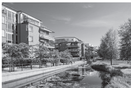
Le projet d'éco-quartier des Cherpines à Genève. URL : http://www.urgence-logements.ch/campagnes-politiques/les-cherpines/

en ville : recours aux énergies non fossiles, récupération des eaux pluviales, utilisation de matériaux recyclables ou produits in situ , recyclage des déchets... L'eau et le végétal sont au centre de leur conception en tant que garants de biodiversité. Mais la nature est introduite à travers l'utilisation de techniques, certes innovantes, mais reproductibles et standardisées, imposées par des normes nationales et internationales contraignantes. Il en résulte un cadre de vie de qualité et faiblement énergivore, mais une homogénéisation architecturale et urbaine qui labellise l'image et l'esthétique des quartiers durables, quel que soit leur contexte. L'exemple le plus frappant étant probablement la diffusion des façades végétalisées sur les immeubles comme « la forêt végétale » de Milan, « les tours vertes » de Nantes ou de Manhattan, voire « les maisons vertes » vietnamiennes.