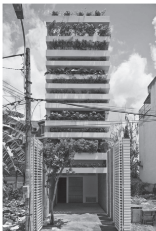
« Stacking Green » à Ho Chi Minh Ville (Viêt-nam), maison verticale de 4 mètres de large pour 20 mètres de haut qui a la particularité d'être abondamment végétalisée (conçue par l'agence Vo Trong Nghia)

viaires 16 , qui constituent de véritables lieux de reproduction de la faune et de la flore, tout autant qu'un potentiel de production de trames vertes souvent ignoré. Elle constitue un lieu d'accueil privilégié des exclus de la ville, comme en témoigne l'installation de baraquements le long du boulevard périphérique parisien ou à l'entrée des autoroutes.