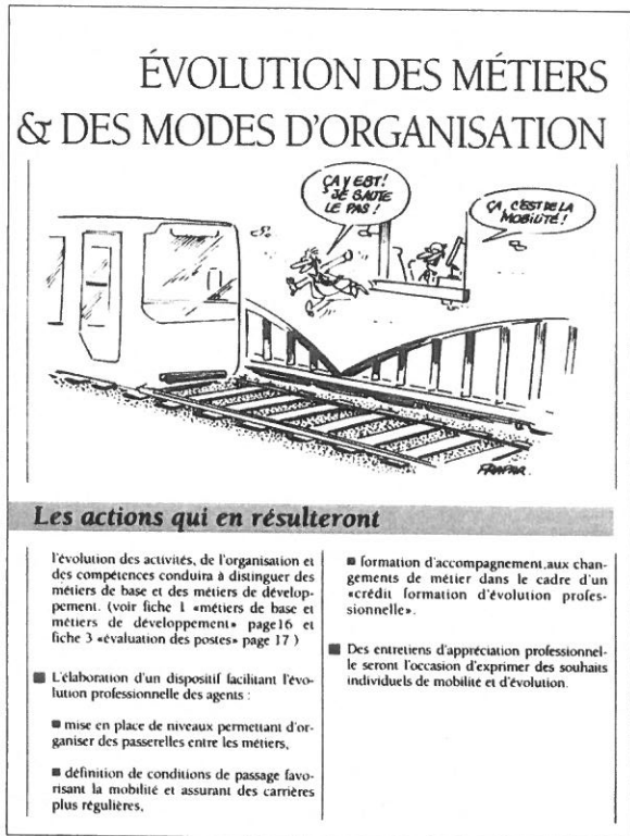
Le progrès partagé (p. 14-15), Ratp.

Dans la première vignette, deux «bureaucrates» s'ennuient, l'air triste. L'un, tapote d'une main sans conviction et rêve à une autre vie, à une vraie vie, celle de conducteur, symbole du service de l'exploitation à la