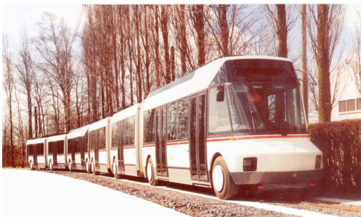
Photo de 2 GLT (ancêtre du TVR) bi articulés, accouplés en une rame multiple. La Brugeoise et Nivelles avance une capacité potentielle, à 6 voyageurs au m 2 , de 400 à 600 voyageurs selon que l'on accouple deux ou trois véhicules ensemble.

Si, par exemple, le fait de pouvoir être accouplé en rames à unités multiples n'a pas été réellement considéré, cette affirmation a probablement contribué à nourrir l'imaginaire de ce véhicule. D'ailleurs, vingt ans plus tard, le directeur de l'APTS, le constructeur du Phileas, reprendra cet argument en énonçant " la possibilité d'accrocher 2 véhicules " [TEC n°184, 2004, p.27] sans se soucier de la faisabilité juridique de cet agencement. Par contre, le fait qu'il représentait une économie d'infrastructure, qu'il ne nécessitait pas la construction d'un nouveau dépôt, que, grâce à sa bimodalité de conduite, la construction du site pouvait être progressive et donc son financement étalé sont apparus comme une évidence. Pour l'essentiel, le Gart (Groupement des autorités responsables de transport), dans un rapport de 1995, reprendra cet argumentaire et l'État considérera également cette innovation comme porteuse d'avenir et l'encouragera financièrement, en subventionnant les agglomérations et en structurant, autour d'un GIE, la compétition entre les constructeurs.