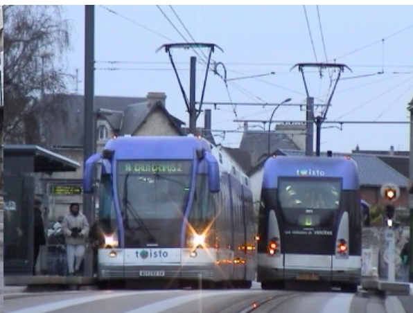
Le TVR de Bombardier