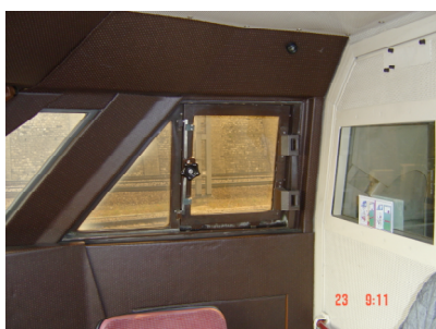
Ouvrant dans le poste de conduite du TGV

Citadis de la T2 à Paris, les conducteurs ont pu obtenir que la porte de cabine puisse être ouverte ou fermée à leur convenance, il n'en a pas été de même pour la recomposition du rapport vis-à-vis de l'extérieur car des problèmes de structure viennent empêcher tout remaniement simple. Les mêmes problèmes sont présents sur les véhicules intermédiaires dès lors qu'ils ont calqué leur conception sur celle des tramways, qui eux-mêmes ne l'ont