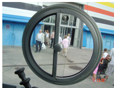
«L'hygiaphone» du Phileas