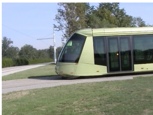
Le Translohr de Lohr Industrie