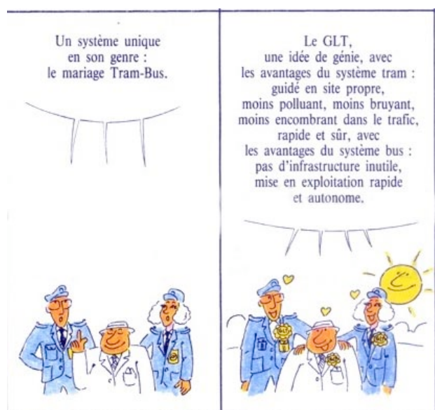
Publicité de la Brugeoise et Nivelles pour le Guided Light Transit, modèle à plancher haut précédant le TVR.

ce programme. Le TVR semble sans suite, le Translohr est devenu un tramway à part entière, le guidage optique n'est utilisé que pour l'accostage, à Rouen, unique ville où il reste opérationnel. Douai et le Phileas sont les seuls à continuer l'aventure des véhicules intermédiaires.