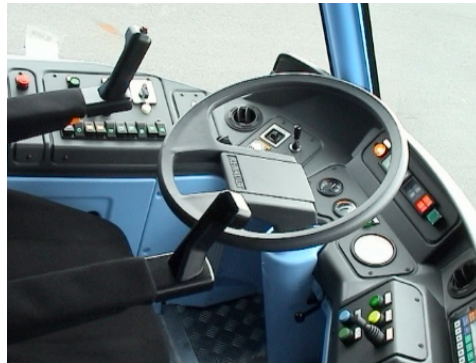
Bouton d'actionnement de la clochette sur la poignée de l'accoudoir de gauche du TVR, confondu avec un bouton d'actionnement de la veille

Une dérive similaire apparaît sur le Philéas où son futur exploitant à Douai, le SMTD, a souhaité qu'il soit équipé d'une veille. Le Philéas ne devant être exploité commercialement qu'en mode guidé, le SMTD a en effet considéré qu'un système de veille s'imposait sur le véhicule, d'autant plus qu'il était certain que le TVR en circulation à Caen disposait d'un tel système. Dans les faits, le SMTD a confondu, sur le TVR, la clochette, actionnée par un bouton disposé sur la poignée de maintien située à l'extrémité de l'accoudoir gauche du véhicule, avec un système de veille (photo ci après). Sans aucun contrôle du fait qu'il s'agissait bien d'un tel dispositif, et non démenti par les conseils et experts dont il s'est entouré, dont la RATP, le SMTD a indiqué dans le projet de Dossier préliminaire de sécurité qu'un système de veille, dont le mode de fonctionnement est identique à celui des tramways à manipulateur de traction, équiperait le véhicule douaisien. Pensant introduire un dispositif en vigueur sur le TVR et non contesté par les conducteurs (et pour cause !), le SMTD s'inscrit dans le même schéma que Lohr Industrie pour le Translohr. Il propose d'installer, sur un véhicule à conduite à pédalier, un dispositif qui n'est en vigueur sur aucun tramway de ce type et, bien que le Philéas n'en soit pas équipé d'origine, aucune analyse de sûreté de ce dispositif de sécurité n'accompagne cette nouvelle implantation.