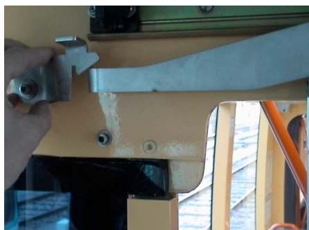
Bricolage réalisé sur les Citadis de la T2 de la RATP pour que les conducteurs puissent maintenir entrouverte leur porte.

Sur le TVR, le Civis et le Translohr, la cabine de conduite est isolée, par une porte, du compartiment voyageurs et ne dispose d'aucun ouvrant sur l'extérieur, créant une sensation de confinement et d'isolement et interdisant tout échange avec l'environnement extérieur en contradiction avec les besoins de communication directe observés dans la conduite des bus. Cette conception reflète celle des tramways les plus récents à qui les véhicules intermédiaires ont donc manifestement emprunté. Si, pour les tramways, par une action syndicale comme à Nantes ou par un bricolage, comme sur les