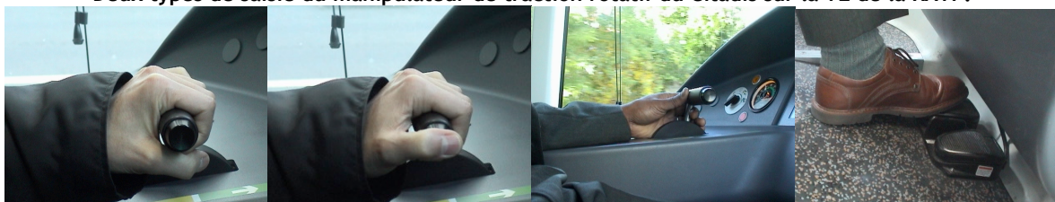
Deux types de saisie du manipulateur de traction rotatif du Citadis sur la T2 de la RATP.

Sur les deux premières photos, le conducteur peut activer la veille avec le pouce (2 ème photo) en même temps et dans le même mouvement qu'une action sur le manipulateur traction. Sur la 3 ème photo, cette saisie ne permet plus d'activer simultanément la veille. Elle n'est possible que parce qu'une pédale d'activation de la veille a été ajoutée (4 ème photo).