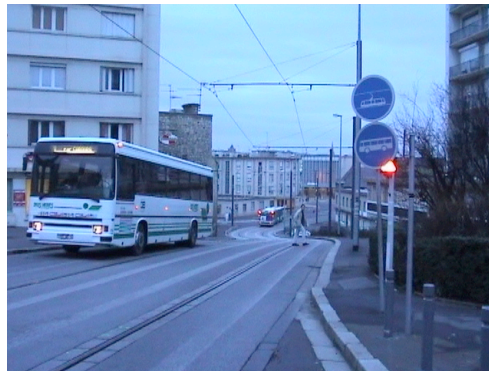
Caen ☐ Signal clignotant indiquant la priorité aux piétons

La confusion signalétique de ce carrefour important a entraîné les habitants du quartier à adopter des stratégies alternatives pour le traverser. Dans ce passage piétons, qui n'en était pas véritablement un, ils n'étaient pas sûrs d'être protégés. Ils traversaient donc en contrebas du passage. C'est à cet endroit, très précisément, qu'a eu lieu l'accident où a été tué un petit garçon de dix ans, le jeudi 21 octobre 2004, renversé par un TVR, accident déjà évoqué à propos de l'absence de chasse-corps sur le TVR.