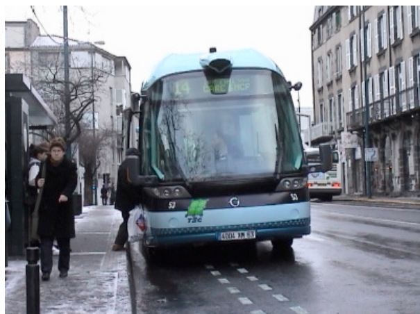
Le Cibus d'Irisbus et le guidage optique de Siemens