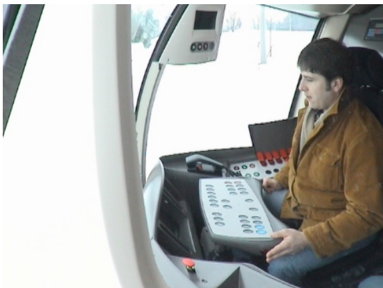
Poste de conduite du Translohr

Inversement à cette tendance au « déguisement » des bus en tramway, le Translohr, qui a tardivement abandonné la bimodalité pour être exclusivement un tramway sur pneus, conserve maints des attributs du bus avec un système de traction-freinage par pédalier, un poste de conduite décentré à gauche et une console de contrôle-commande qui s'inscrit dans l'emplacement du volant disparu et dont la référence est explicitement celle de la bureautique. Par rapport à un poste de conduite de tramway, où l'espace est toujours dégagé devant le conducteur, les commandes étant réparties sur les côtés, cette configuration, totalement inédite, génère des conséquences négatives sur le travail de conduite, notamment en termes de réglages de la position de conduite et d'accessibilité aux informations sur les différents écrans de visualisation.