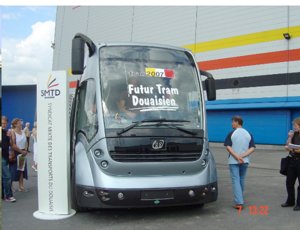
Le Philéas de l'APTS (Pays-Bas)

Ces objets peuvent être aussi bien un système de veille en charge de contrôler la défaillance éventuelle des êtres humains (en l'occurrence les conducteurs) qu'un pare brise, un volant, l'espace d'une cabine, un chasse-corps ou un passage piétons. On aura compris, par cette liste, que l'on ne s'est pas cantonné aux seuls objets susceptibles d'être « touchés » tactilement par le conducteur, mais que l'on a voulu, dans une démarche compréhensive vis-à-vis de l'action de conduite, intégrer aussi ceux qui, bien que situés à l'extérieur de la cabine, parfois au loin (un passage piétons) ou invisibles (chasse-corps) permettent (ou pas) de sécuriser leur action.