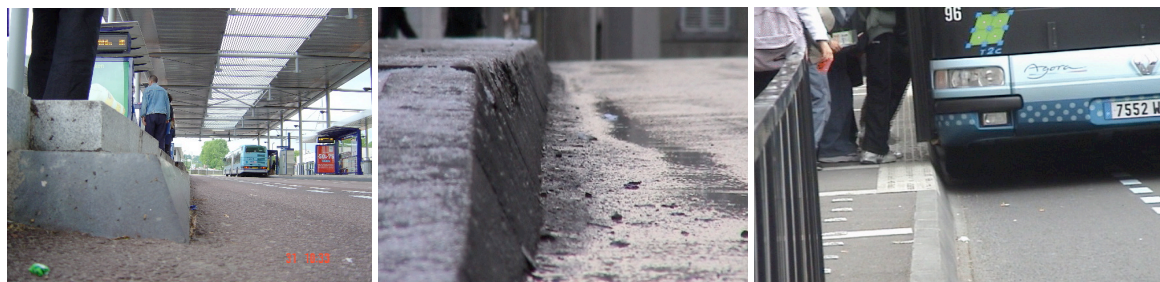
Bordure de trottoir à Rouen sur la ligne Teor (1° photo) et Clermont-Ferrand sur la ligne 14 (2° photo) et accostage au plus près du quai d'un bus de la ligne 14 en conduite manuelle. Les roues touchent le trottoir.

Sur le même mode, la cabine centrée du Civis, prévue essentiellement pour renforcer l'image du guidage automatique par la référence au tram, facilite le travail des conducteurs pour accoster avec une lacune réduite quand, pour des raisons de sécurité, le guidage est désactivé 2 . C'est le cas à Las Vegas où les dépôts de carburant laissés par les voitures sur la chaussée s'accumulent du fait de l'absence de précipitations et rendent illisibles, par la caméra embarquée sur le bus, les marques de guidage tracées au sol.