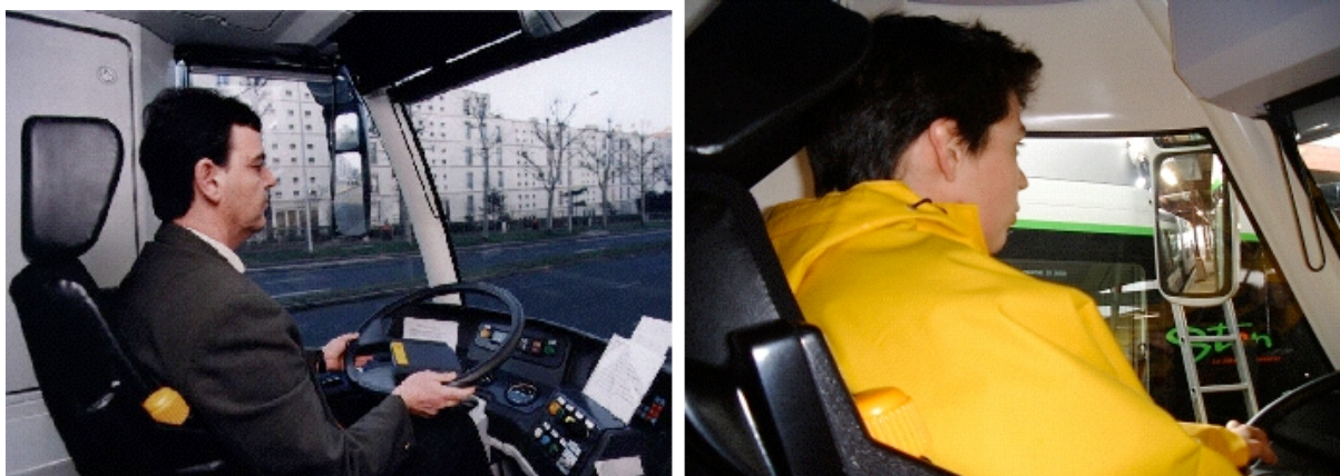
La visibilité sur les rétroviseurs avant et après modification du design

Sur le TVR, les besoins de visibilité sur les côtés et l'avant immédiat du véhicule sont réduits, les demandes de modification du design initial faites par l'AO de Nancy ayant encore accru les problèmes en masquant une partie de la vue sur les rétroviseurs extérieurs (photos ci-dessous). Bien que le véhicule ait été homologué dans la version initiale, où les trois facettes du rétroviseur sont normalement visibles, la norme est convoquée, par le constructeur, pour empêcher toute remise en question du nouveau design, seule la partie basse du rétroviseur étant réglementairement requise. C'est encore la norme qui est convoquée pour ignorer les risques attachés à la limitation du champ de vision latérale du conducteur, le constructeur faisant valoir que les véhicules de transport de type M3, catégorie de rattachement administratif du TVR, ne sont pas soumis à des normes de champ de vision latérale [Doniol-Shaw et Foot, 2004] 5 .