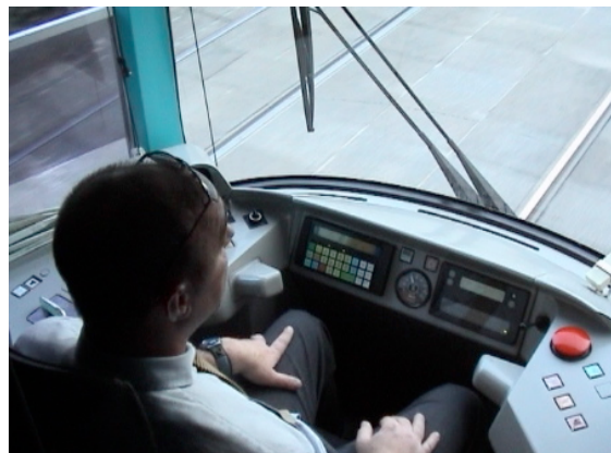
Poste de conduite du Saint Etienne