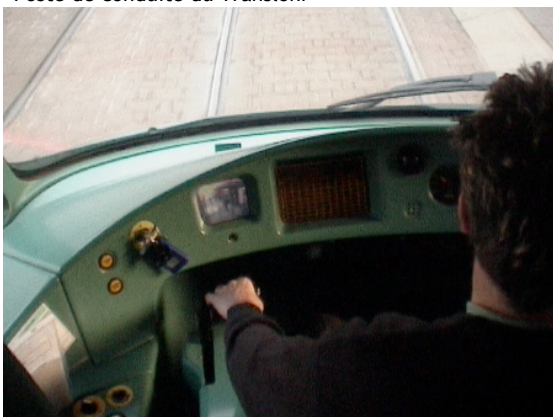
Poste de conduite de l'Eurotram