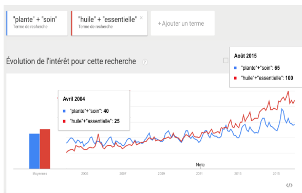
Evolution des occurrences des termes « huile » + « essentielle » et « plante » + « soin » dans les recherches Google en France entre 2004 et 2015

Leur activité de cueillette, confrontée à un contexte réglementaire compliqué, permet une revitalisation des zones rurales, et peut contribuer à la préservation de milieux menacés par la déprise agricole.