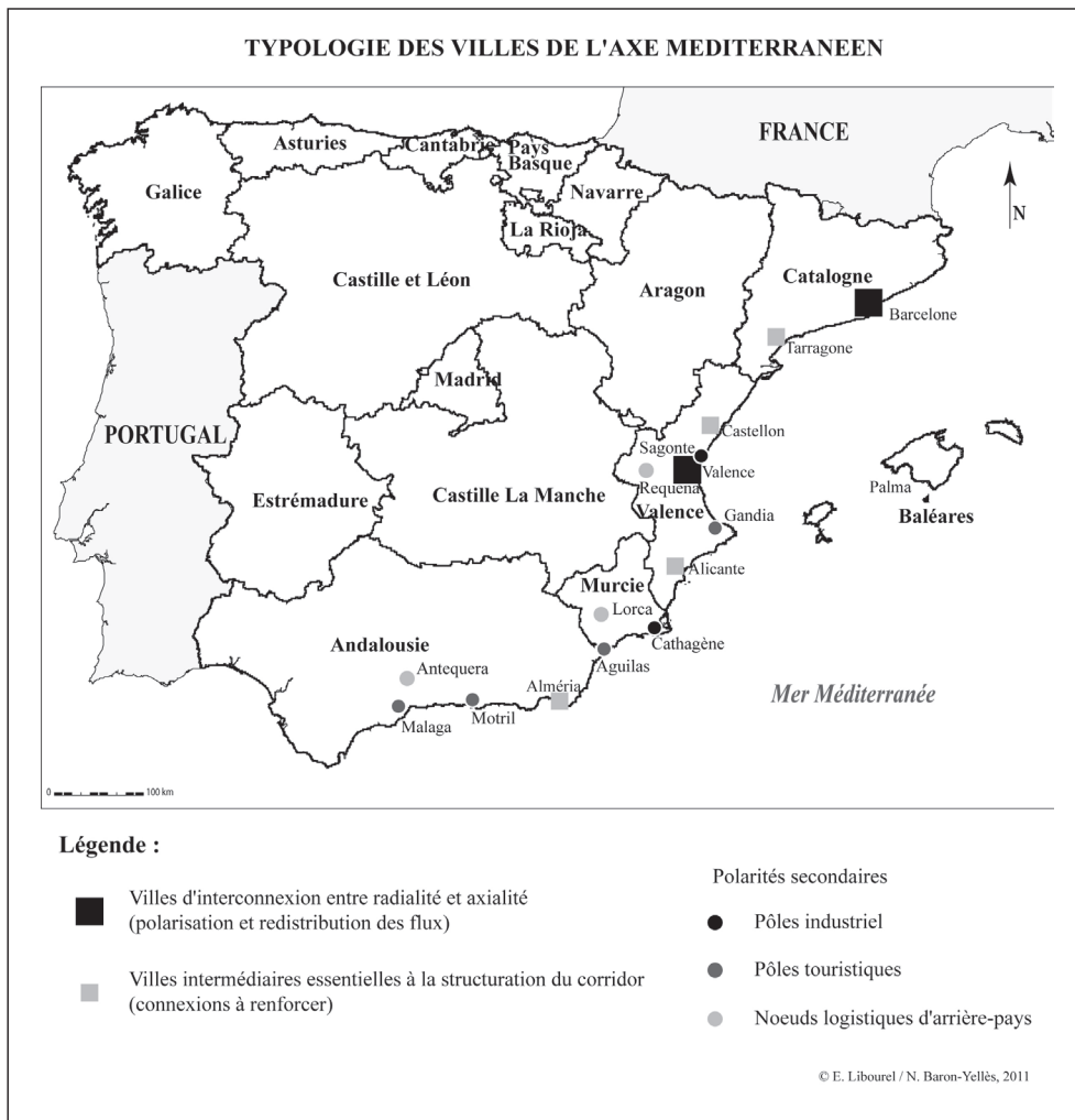
Figure 6. Typologie des villes de l'axe méditerranéen.

Ainsi, la territorialisation de la grande vitesse espagnole ne s'est pas encore structurée à l'échelon urbain parce que la logique d'opposition entre pouvoir étatique et autorités régionales était trop forte. La ville moyenne était au mieux au centre d'un marché de négociations entre l'État et la Generalitat, comme c'est le cas de Castellón. On est certes entré dans une phase de convergence, mais dans une stabilisation très relative des logiques d'acteurs locaux, qui sont en grande partie tenus à l'écart malgré quelques mobilisations comme celle d'Alicante en juillet 2011.