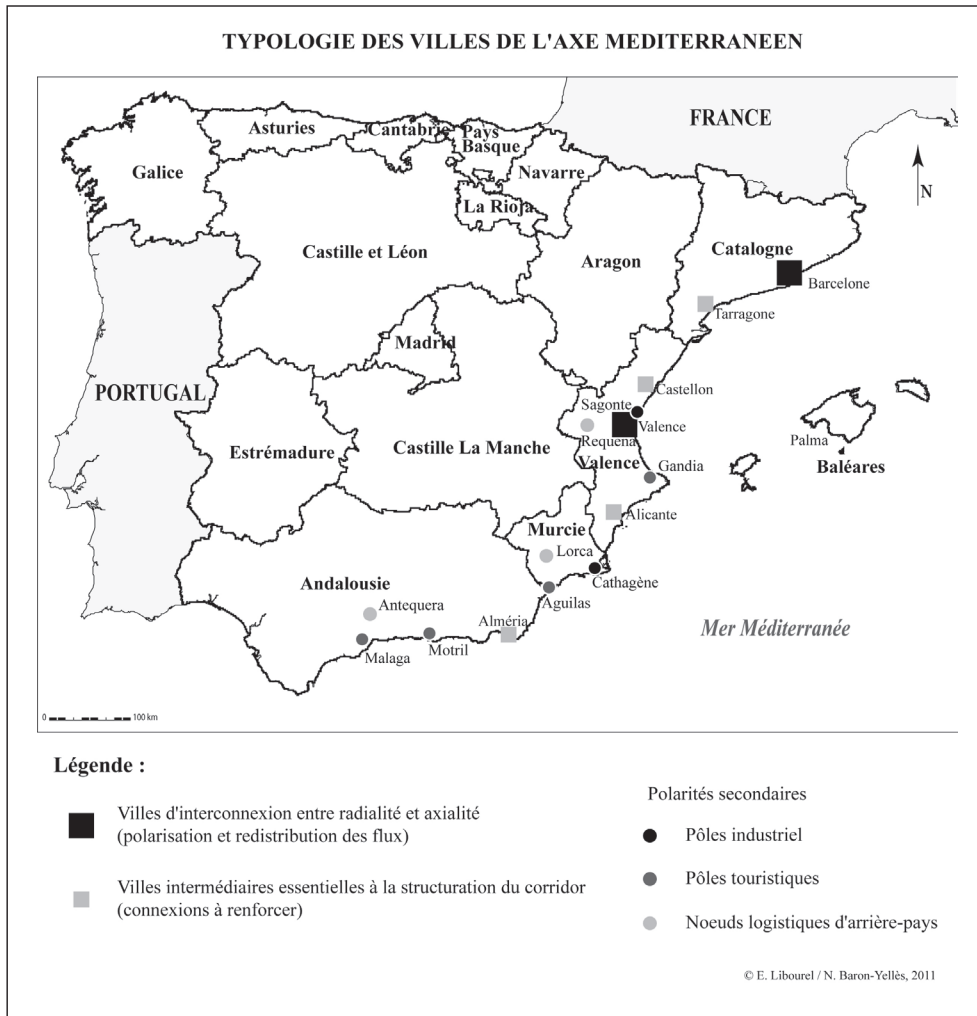
Figure 6. Typologie des villes de l'axe méditerranéen.

Ainsi, la territorialisation de la grande vitesse espagnole ne s'est pas encore structurée à l'échelon urbain parce que la logique d'opposition entre pouvoir étatique et autorités régionales était trop forte. La ville moyenne était au mieux au centre d'un marché de négociations entre l'État et la Generalitat, comme c'est le cas de Castellón. On est certes entré dans une phase de convergence, mais dans une stabilisation très relative des logiques d'acteurs locaux, qui sont en grande partie tenus à l'écart malgré quelques mobilisations comme celle d'Alicante en juillet 2011.