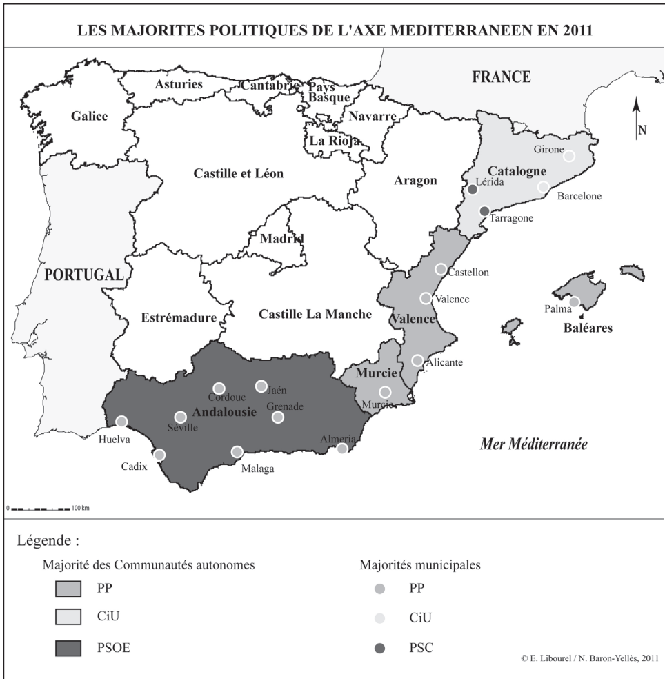
Figure 5. Majorités politiques de l'axe méditerranéen en 2011.

C'est le fondement des stratégies de ces villes moyennes des interstices et des arrière-pays 17 . En particulier, certains pôles sectoriels littoraux assez spécialisés sont concernés, comme Gandia pour le tourisme, Sagonte pour son port ou encore quelques nœuds dans l'arrière-pays comme Requena et Antequera (fig. 6).