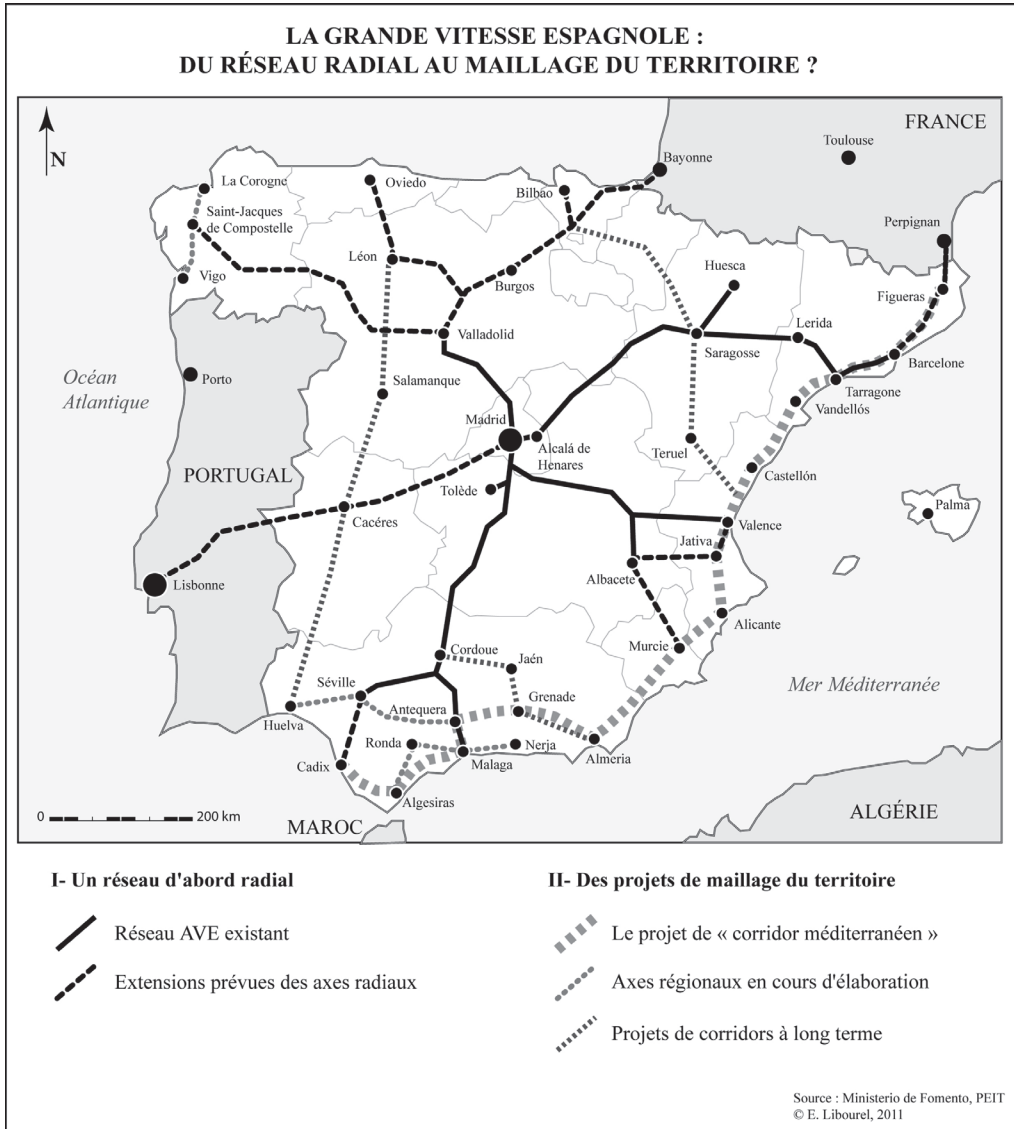
Figure 1. Réseau à grande vitesse existant et projets d'extension.

troisième ville du pays, en octobre 2010. Le développement de la grande vitesse, de ce point de vue, a suivi la logique centraliste qui avait présidé à la création des infrastructures autoroutières et ferroviaires conventionnelles, Madrid étant le centre vers lequel convergent presque toutes les lignes (fig. 1).