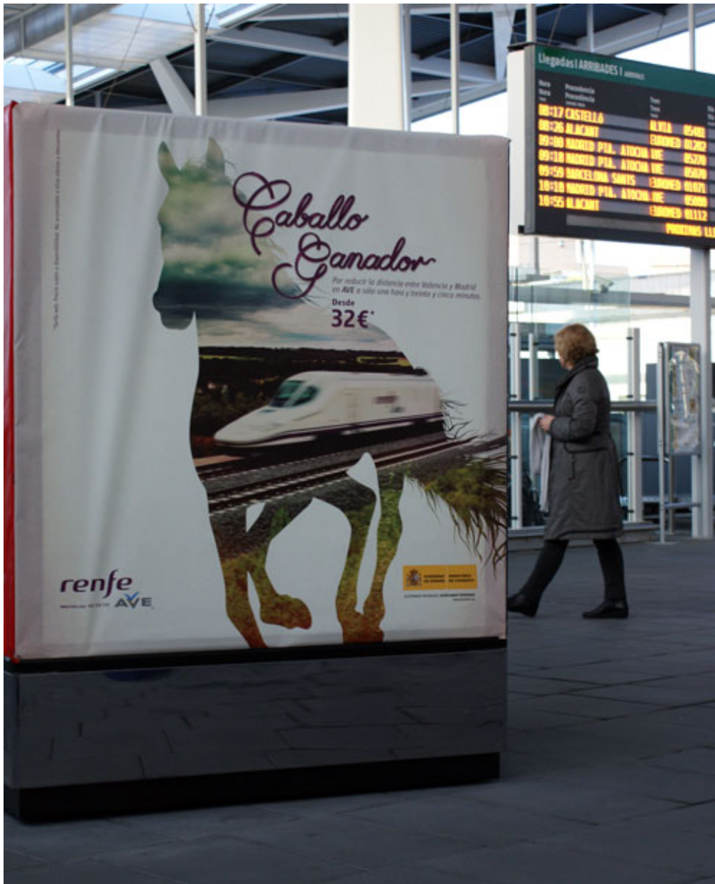
Photo 1 : Publicité de Renfe dans la gare de Valence Joaquín Sorolla