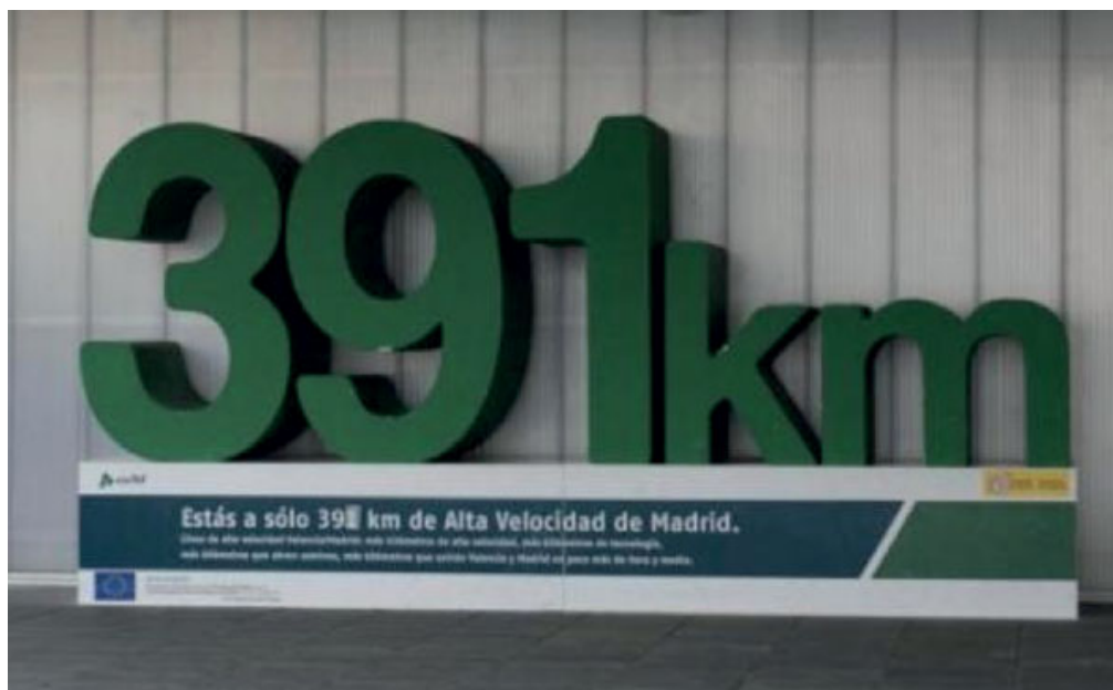
Photo 2 : Dispositif mettant en valeur la distance Madrid-Valence dans la gare Joaquín Sorolla