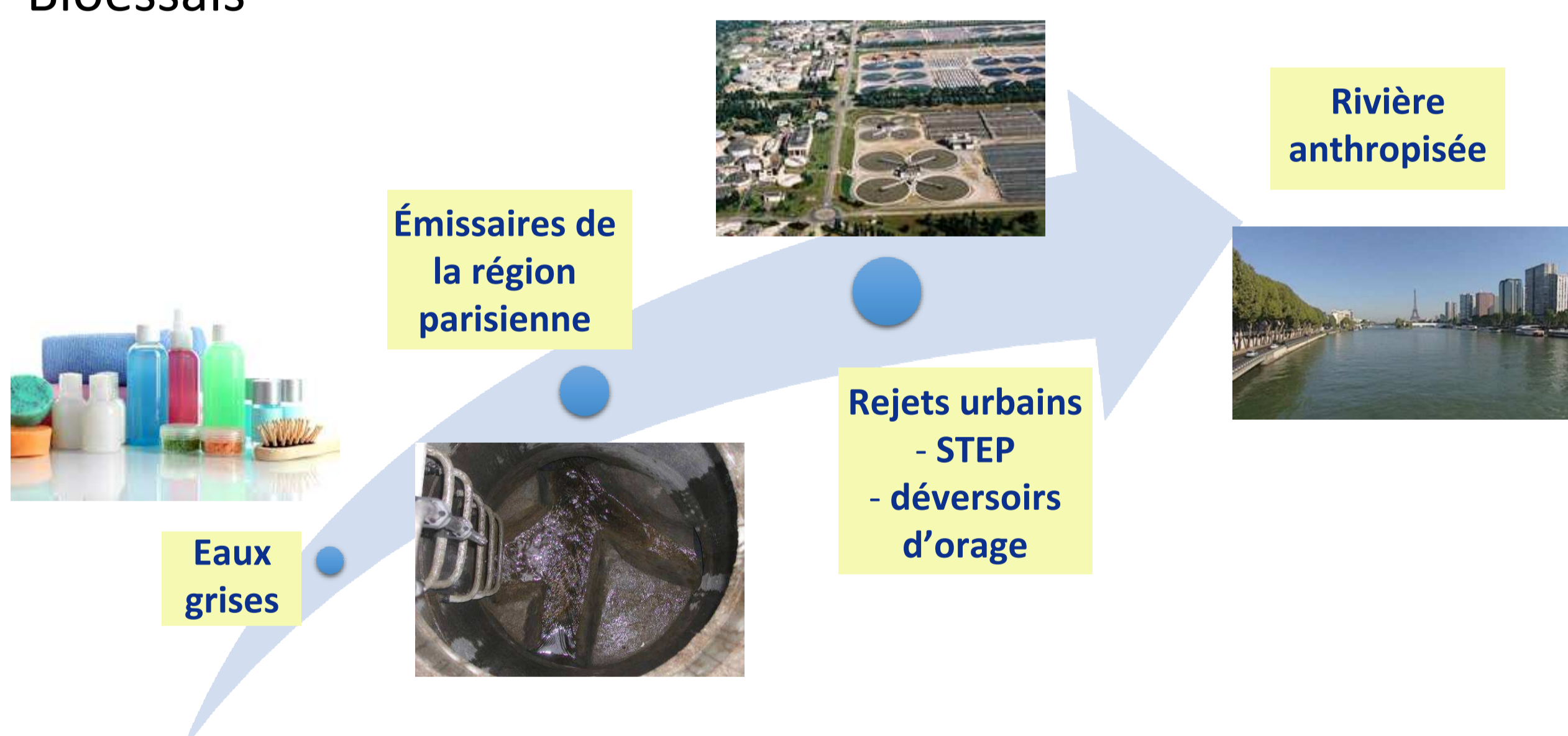
Figure 2 : Points du cycle urbain de l'eau échantillonnés dans le projet