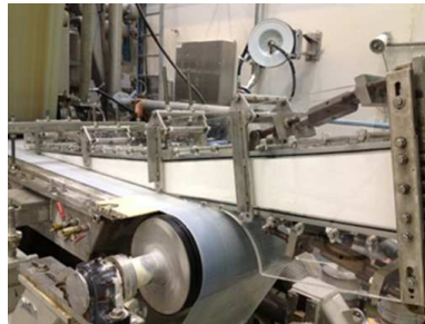
Figure 4 : Fabrication sur la caisse de tête d'une machine pilote