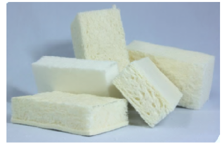
Figure 5 : Blocs de mousses de cellulose thermo isolants

Les mesures des propriétés mécaniques et thermiques permettent d'identifier les interactions entre les composants et d'optimiser leurs proportions pour améliorer les performances.