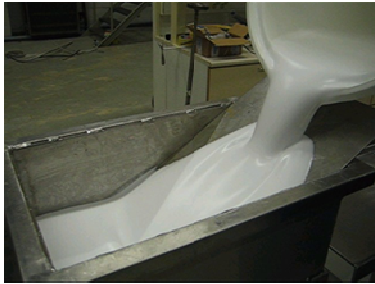
Figure 3 : Fabrication au laboratoire

Les figures 3 à 5 présentent les produits obtenus.