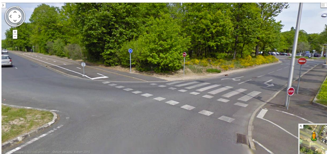
Obr. 2. Detail pěší cesty vedoucí souběžně s cyklostezkou v řešené části Orleáns dle kamery StreetView. StreetView umožňuje získat detailní informace včetně svislého a vodorovného dopravního značení.

V rámci fáze přípravy dat k analýzám proběhla konfrontace českých a francouzských zdrojů dat. Proces konfrontace datových zdrojů na obou národních úrovních odhalil u některých požadovaných datových sad, především z oficiálních zdrojů významné rozdíly. S ohledem na analýzy prováděné v rámci výzkumu se nejvýznamnější rozdíly projevily u zdrojů informací o počtech obyvatel a u ploch funkčního využití území. Tyto rozdíly jsou podrobněji diskutovány dále.