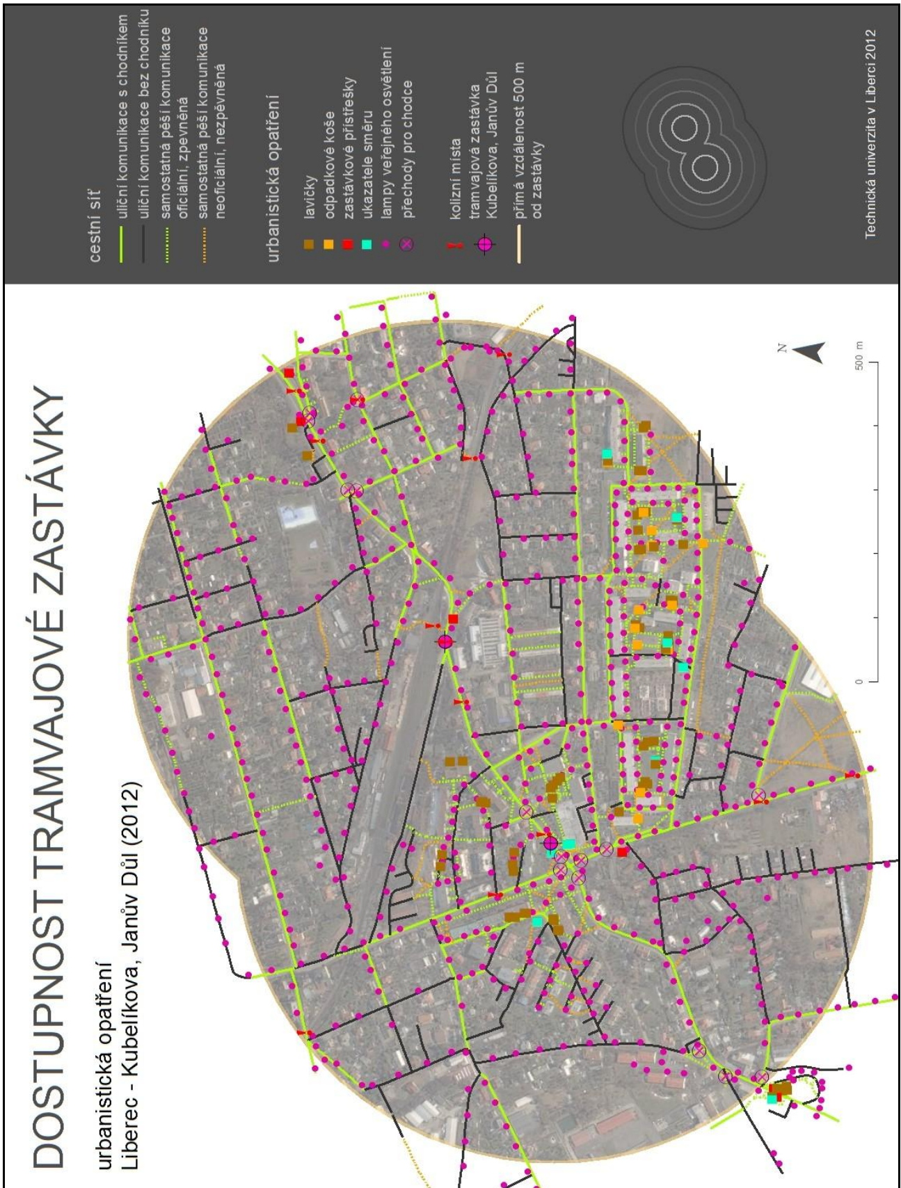
Obr. 3. Cestní síť a doprovodná urbanistická opatření jako příklad části datového modelu výzkumu; lokalita Liberec- Kubelíkova/Janův Důl