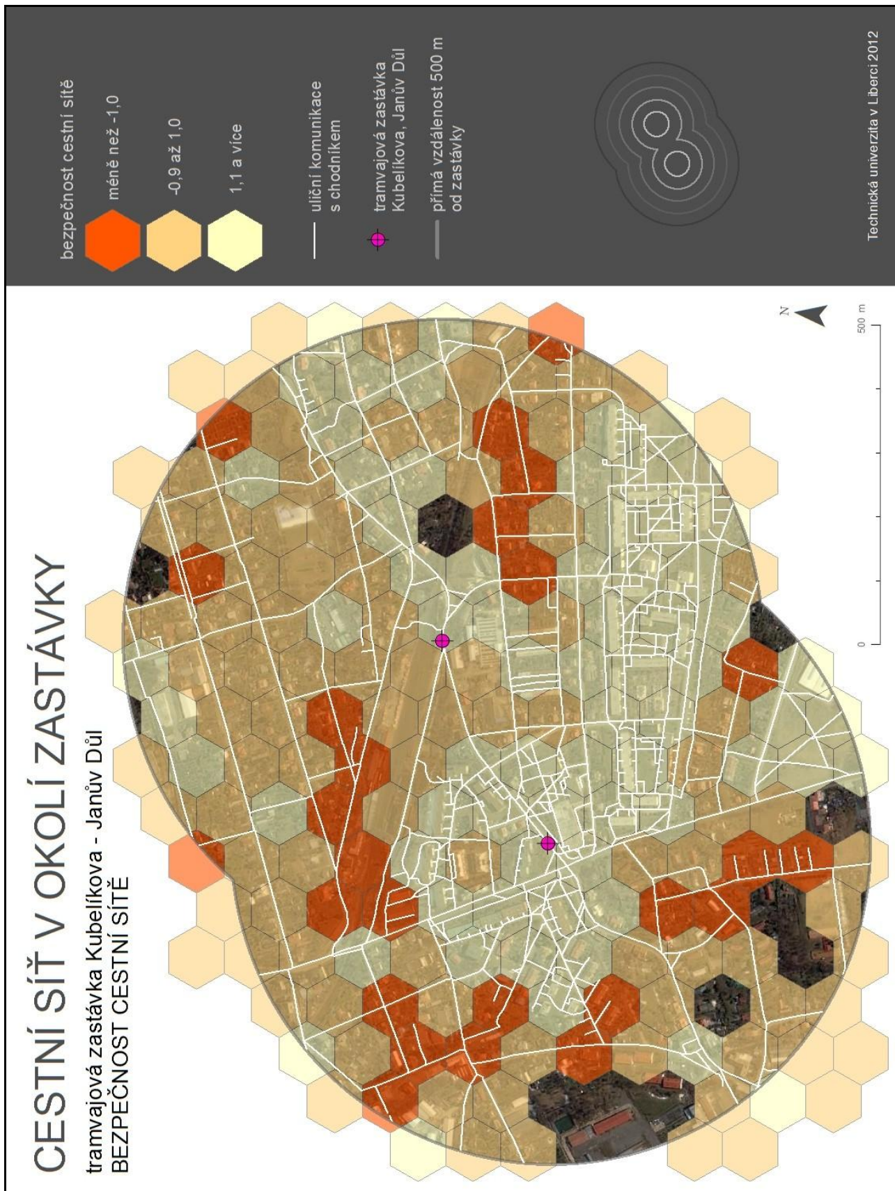
Obr. 5. Hodnocení kvality cestní sítě v kritériu bezpečnost agregací hodnot do hexagonální mřížky o rozlišení 100 m pro lokalitu Liberec – Kubelíkova/Janův Důl