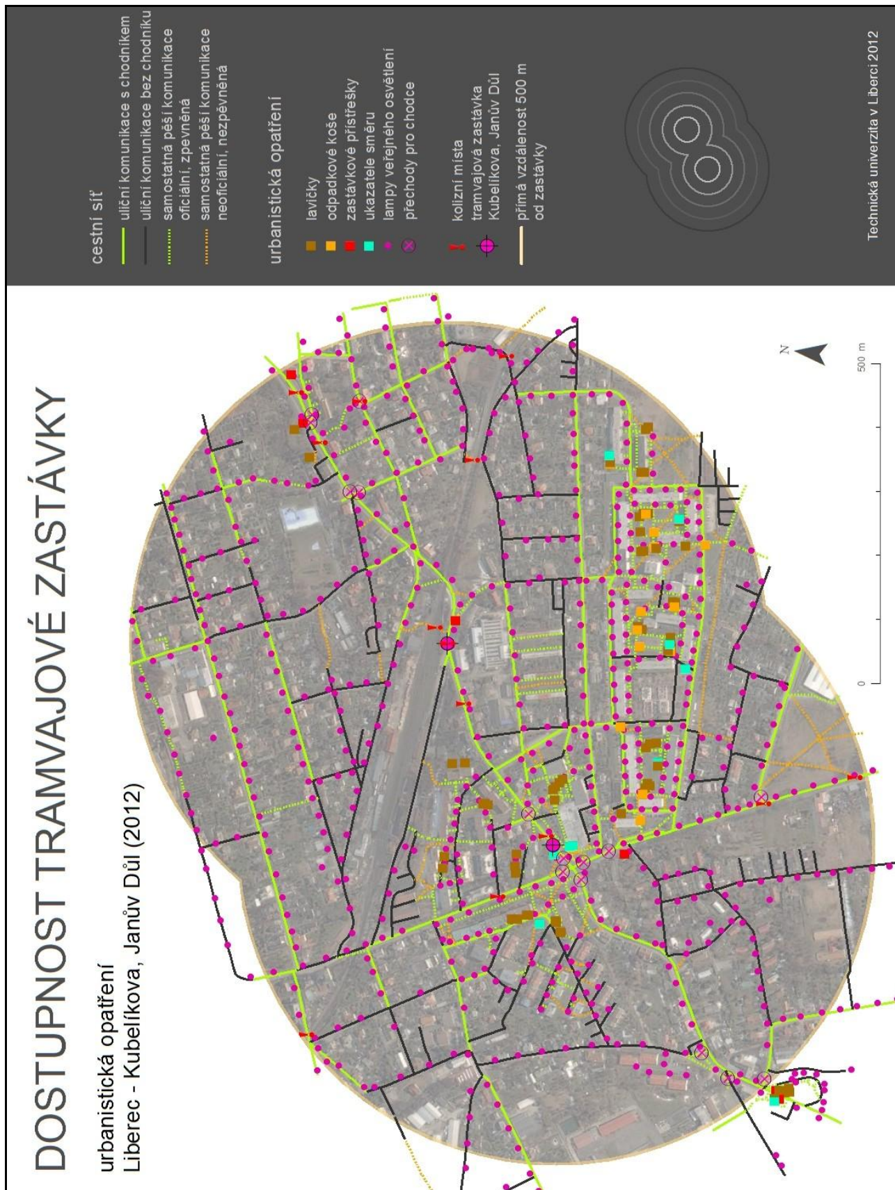
Obr. 3. Cestní síť a doprovodná urbanistická opatření jako příklad části datového modelu výzkumu; lokalita Liberec- Kubelíkova/Janův Důl