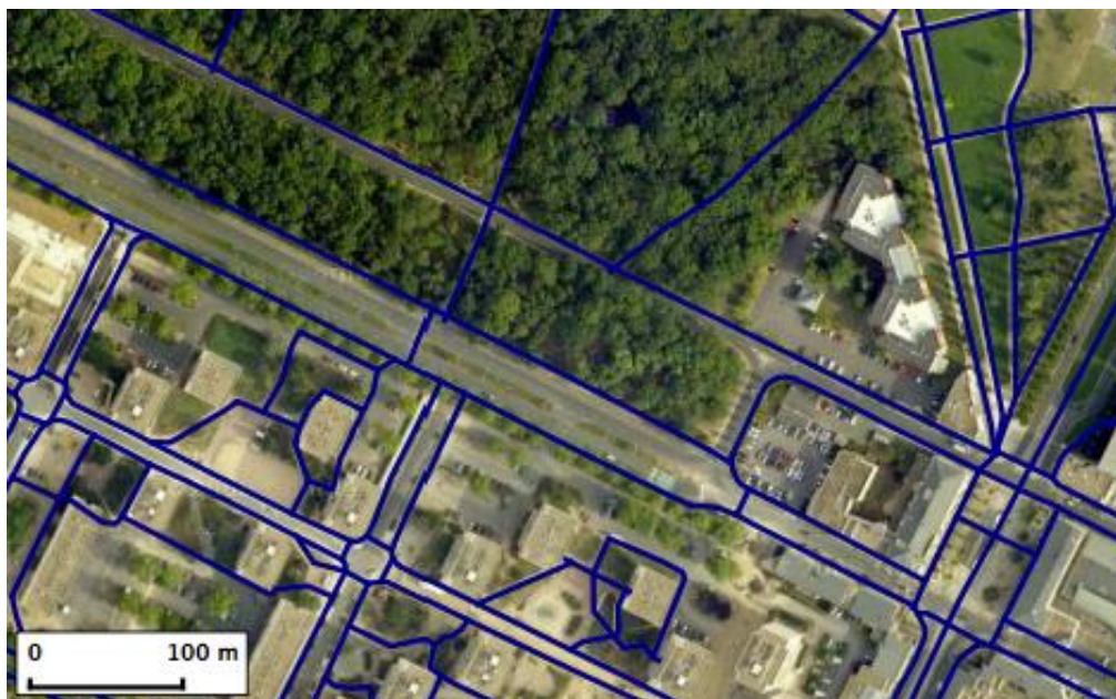
Obr. 1. Cestní síť, Orléan, Francie. Výřez ortofotosnímku zkoumaného území v Orléans s vyznačenými pěšími cestami. Cesty byly převzaty z datové sady OpenStreetMap, IGN a doplněny zákresem situace nad ortofotosnímkiem a doplněno informacemi ze StreetView. Tato data slouží jako podklad pro terénní šetření.

založena na neziskové aktivitě dobrovolníků. Při použití dat OSM je nezbytné ověřit, zda pro dané území odpovídají skutečnosti. Na druhou stranu jsou data OSM oproti jiným komerčním zdrojům dat mnohdy významně častěji aktualizována, právě díky dobrovolné spolupráci velké komunity (200 000 členů v roce 2010; Longley, 2011). Tím odpadají značné náklady nebytné pro zajištění terénních informací k aktualizaci dat.