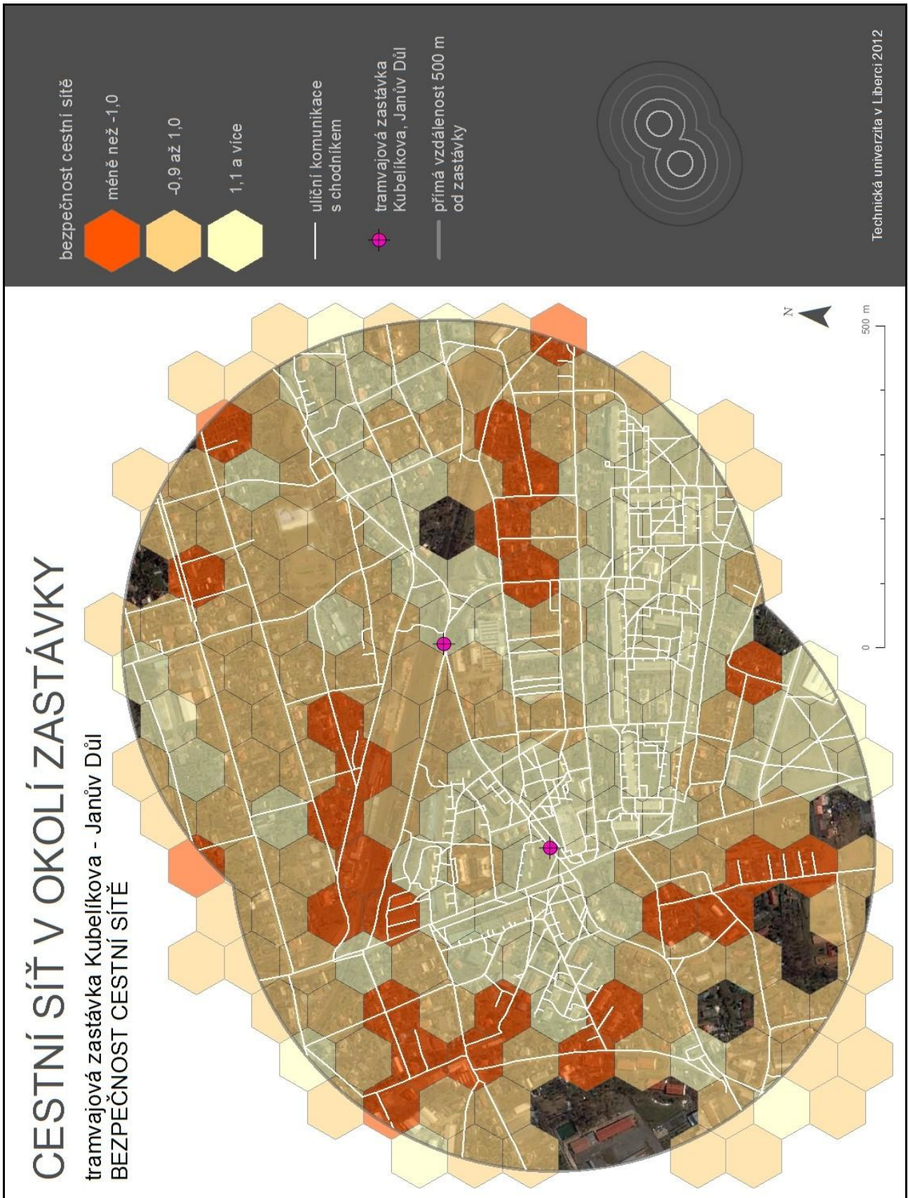
Obr. 5. Hodnocení kvality cestní sítě v kritériu bezpečnost agregací hodnot do hexagonální mřížky o rozlišení 100 m pro lokalitu Liberec – Kubelíkova/Janův Důl