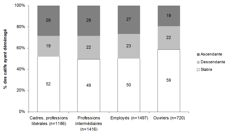
Graphique 2 : Mobilité résidentielle par catégories sociales selon le profil social de la commune de résidence avant et après déménagement