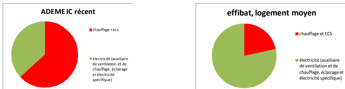
Figure 1 : répartition des consommations énergétiques en énergie primaire, à gauche, d'un logement moyen construit après 1975, (Ademe, 2009) à droite d'un logement dans le projet Effibat

La Figure 1 permet de mieux comprendre les changements auxquels sont soumis les logements. Elle représente la répartition des consommations globales d'une année d'un logement exprimées en énergie primaire 1 . Figure 1 à gauche, il s'agit des consommations moyennes mesurées sur un an pour un logement collectif construit après 1975 selon les chiffres clés du bâtiment (Ademe, 2009). A droite, il s'agit des consommations calculées pour le logement moyen du projet EFFIBAT (Effibat, 2009), développé dans le cadre de l'appel à idées CQHE qui anticipe l'évolution des logements et de leur consommation d'énergie dans une perspective à 15 ans.