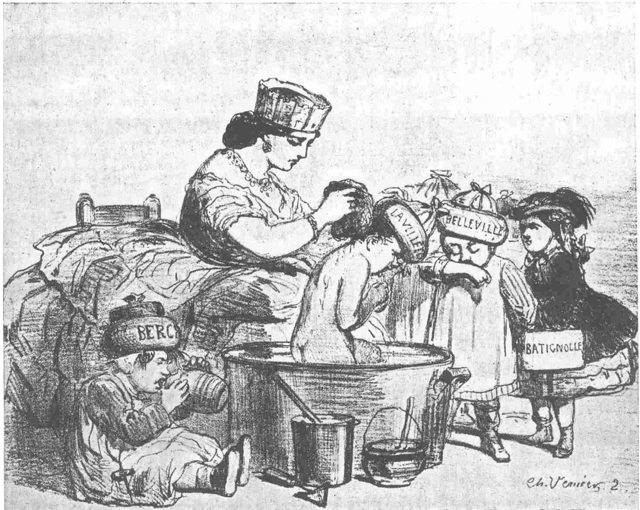
Photo 1 : Charles Vernier, « la bonne ville de Paris et ses nouveaux enfants », Le Charivari , « actualités », 31 janvier 1860, p. 143.