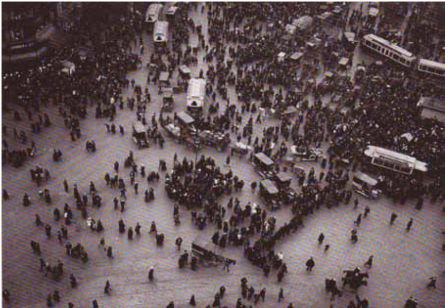
1. LÉON GIMPEL, LA FOULE PARISIENNE UN JOUR DE FÊTE, 27 FÉVRIER 1913 (SOCIÉTÉ FRANÇAISE DE PHOTOGRAPHIE).

Cette radicalité de la vue aérienne, incitant à adopter perspectives et cadres de vue inédits, gagne le milieu artistique dans ses différents courants, cubiste,