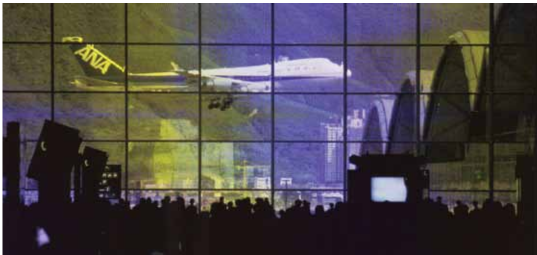
5. HONG KONG, AÉROPORT DE CHEP LAP KOK. VUE DEPUIS LE HALL DÉPART. ARCHITECTE: NORMAN FOSTER.

decks , terrasses et restaurants aériens, tout un ensemble de dispositifs scénographiques met en représentation cette attraction urbaine d'un genre inédit 27 .