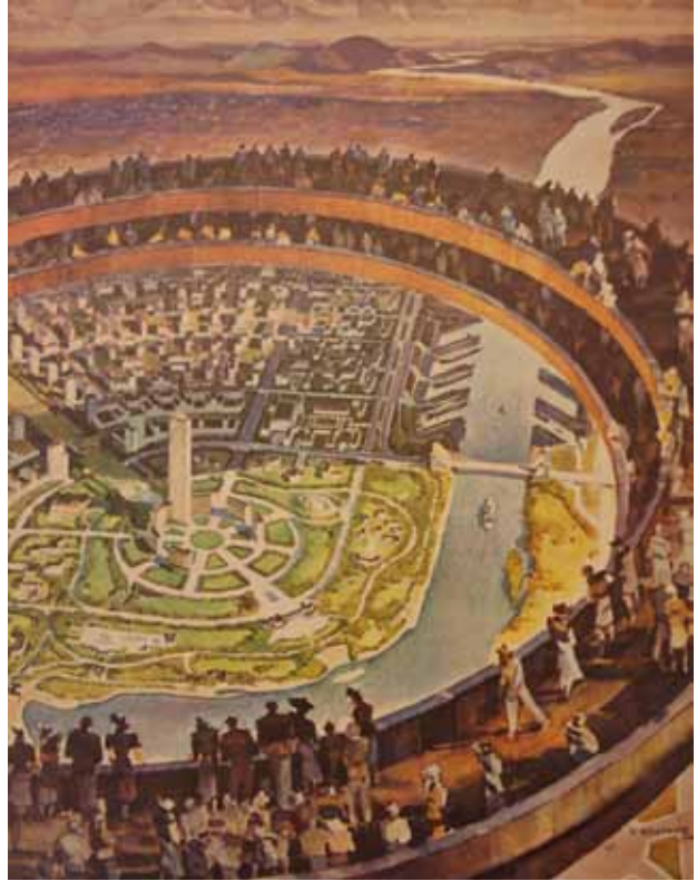
4. HENRY DREYFUSS, DEMOCRACY , NEW YORK WORLD FAIR, 1939 [DRAWINGS AND ARCHIVES, AVERY ARCHITECTURAL AND FINE ARTS LIBRARY, COLUMBIA UNIVERSITY, NEW YORK, COLLECTION W.K. HARRISON.]

Peu après la guerre, c'est l'aéroport lui-même qui devient l'objet du spectacle de la modernité. La nouvelle aérogare d'Orly Sud est un parallélépipède de verre longiligne, d'une dimension et d'une esthétique radicales. La terrasse couronnant l'édifice est un monde en soi, ouvert sur tous les horizons de l'aéroport. À l'intérieur, mezzanines, galeries vitrées, rampes permettent de découvrir des vues plongeantes ou panoramiques sur l'activité aéroportuaire. Avec son collier d'aérogares-joyaux, l'aéroport new-yorkais d'Idlewild dresse un écrin dans lequel l'aéroport se donne en représentation. C'est une fête perpétuelle: les stars défilent, les journalistes commentent, les inaugurations se succèdent. La presse se fait largement l'écho de ces manifestations. Skyrooms , promenades, observation