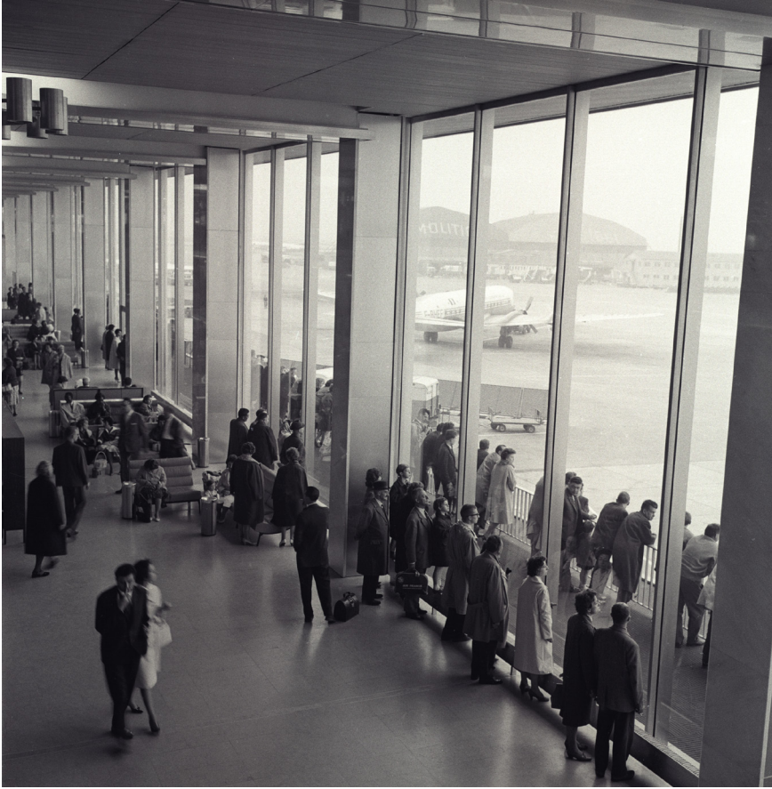
AÉROGARE ORLY SUD, 1961 (IMAGE © AÉROPORTS DE PARIS).

L'étude avait duré plus de trois ans. Parmi les techniques d'entretien auxquelles les enquêteurs avaient eu recours auprès des exploitants et des voyageurs sujets de l'étude, le rêve éveillé, proche de l'examen psychanalytique, présentait l'avantage de placer le sujet dans une situation où ses mécanismes de défense étaient plus facilement abolis. Les conclusions de l'étude mettaient en évidence les sentiments doubles et irrationnels des passagers, partagés entre une représentation persistante mais anachronique de leur statut d'élite privilégiée, et la nouvelle image du voyage aérien, banalisée par sa démocratisation progressive. «Ce n'est plus une aventure ou un luxe, c'est un moyen de transport "banalisé", "vulgarisé" dont la fonction est purement utilitaire» (CEP 1968: 7). Déjà émergeait cette sensation d'être pris entre le rêve d'un transport personnalisé et luxueux, et la réalité imminente d'un transport de masse, contraignant et inconfortable. S'ajoutaient à cela des représentations duales liées à ce mélange d'angoisse et d'excitation, d'euphorie et de nostalgie, qui précède le vol (CEP 1968: 20). «On a l'impression de partir pour l'infini». Pour vivre cette extase de l'ascension, il fallait être seul, rompre les amarres: «une rupture brutale avec le passé, avec soi-même, avec sa vie [...] appartenir presque à l'irréel [...] là tout s'arrête [...] la vie